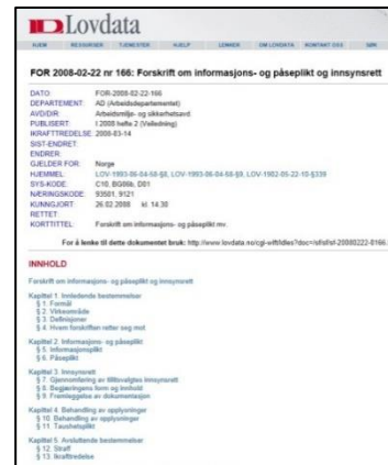
Forskrift om informasjons- og påseplikt og innsynsrett