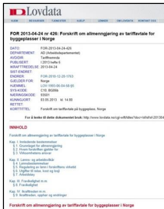
Forskrift om allmenngjøring av tariffavtale for byggeplasser i Norge