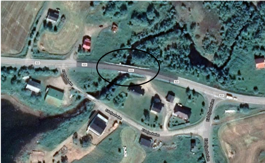
Innringede områder for prosjekt fv. 820 Lakselv bru.