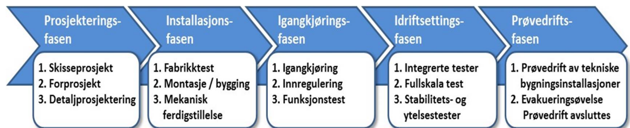
Figur 1 – Prosessene, fasene:

Tekniske entreprenører skal medta kostnader som følger av beskrevet ITB-arbeid.