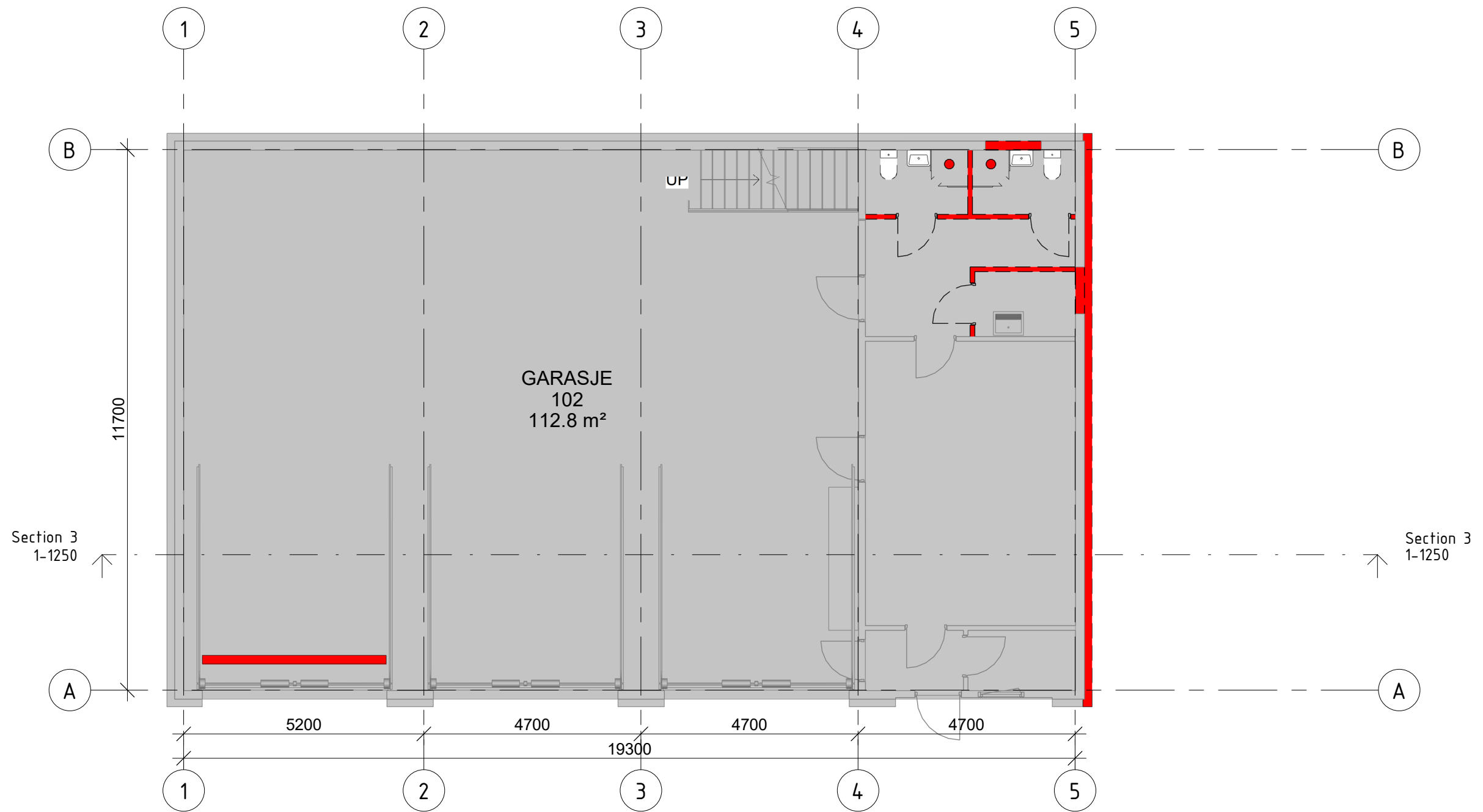
Plan 01 riving 1 : 100