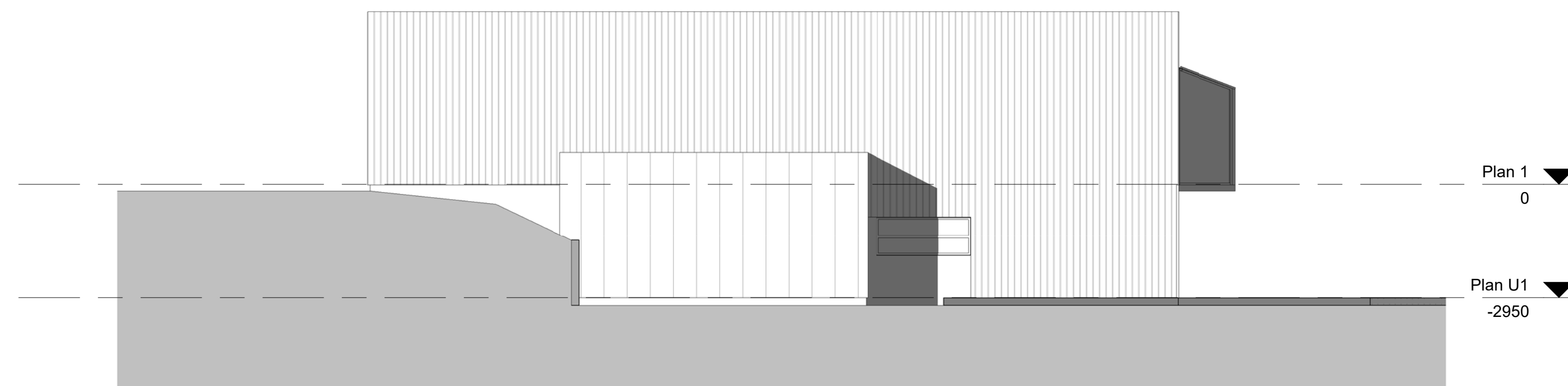
A46.20 Fasade Vest 1 : 100