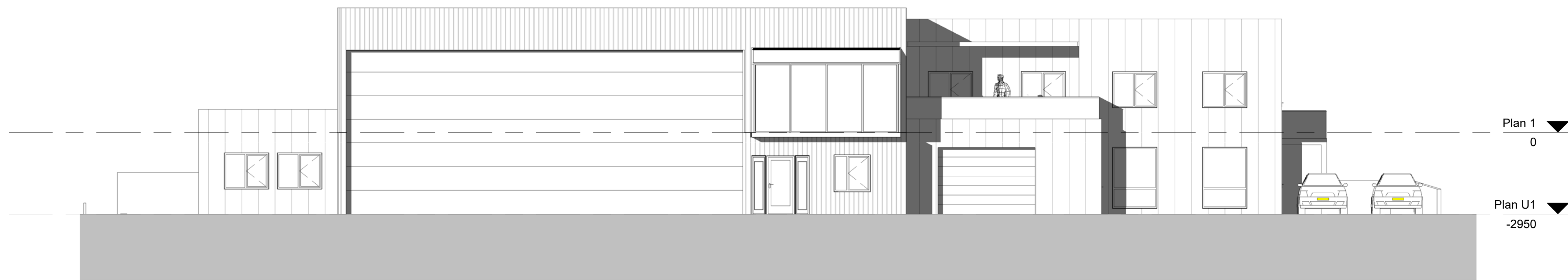
A46.20 Fasade Sør 1 : 100