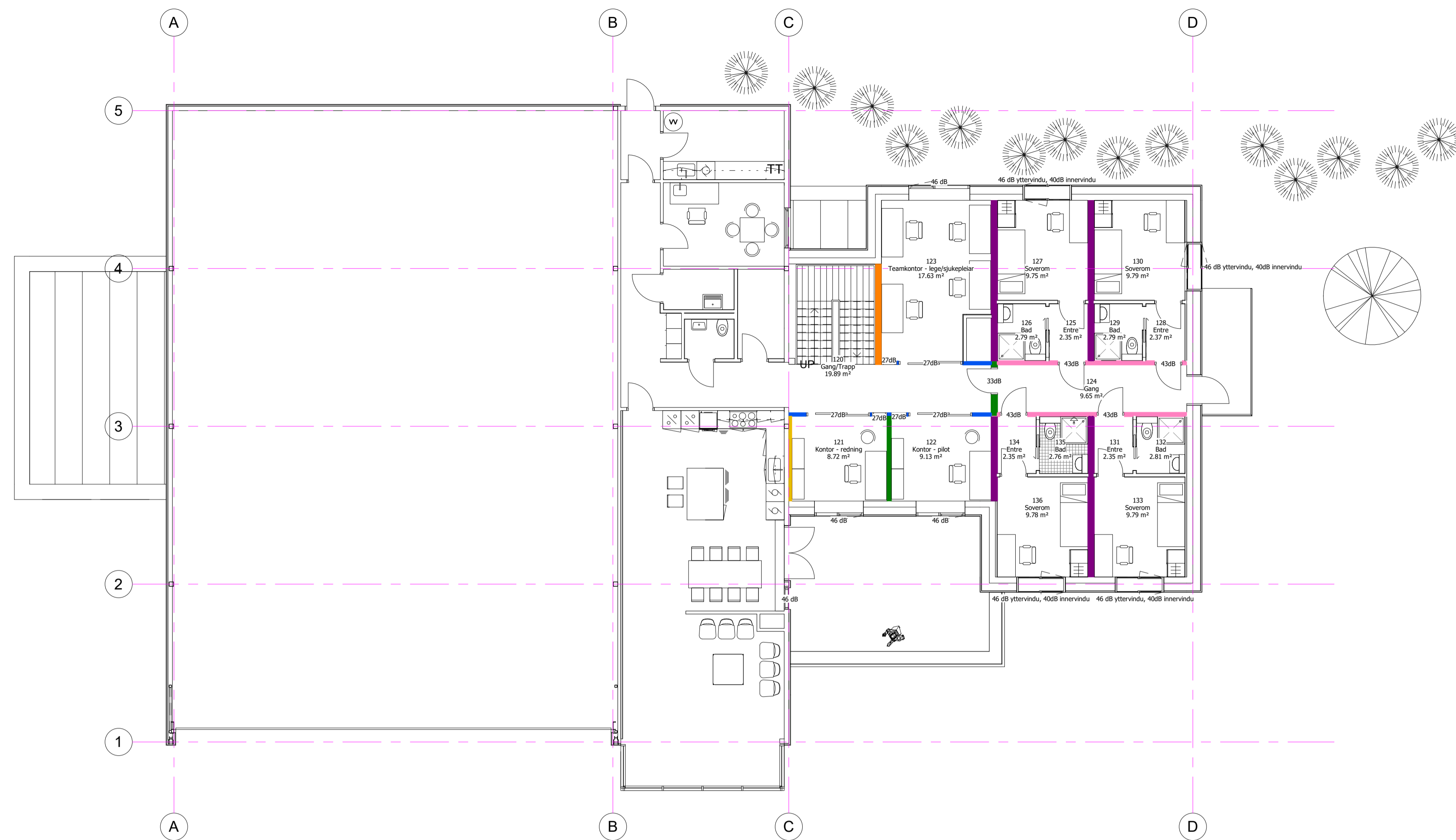
A22.01 Lydplan 1 1 : 100