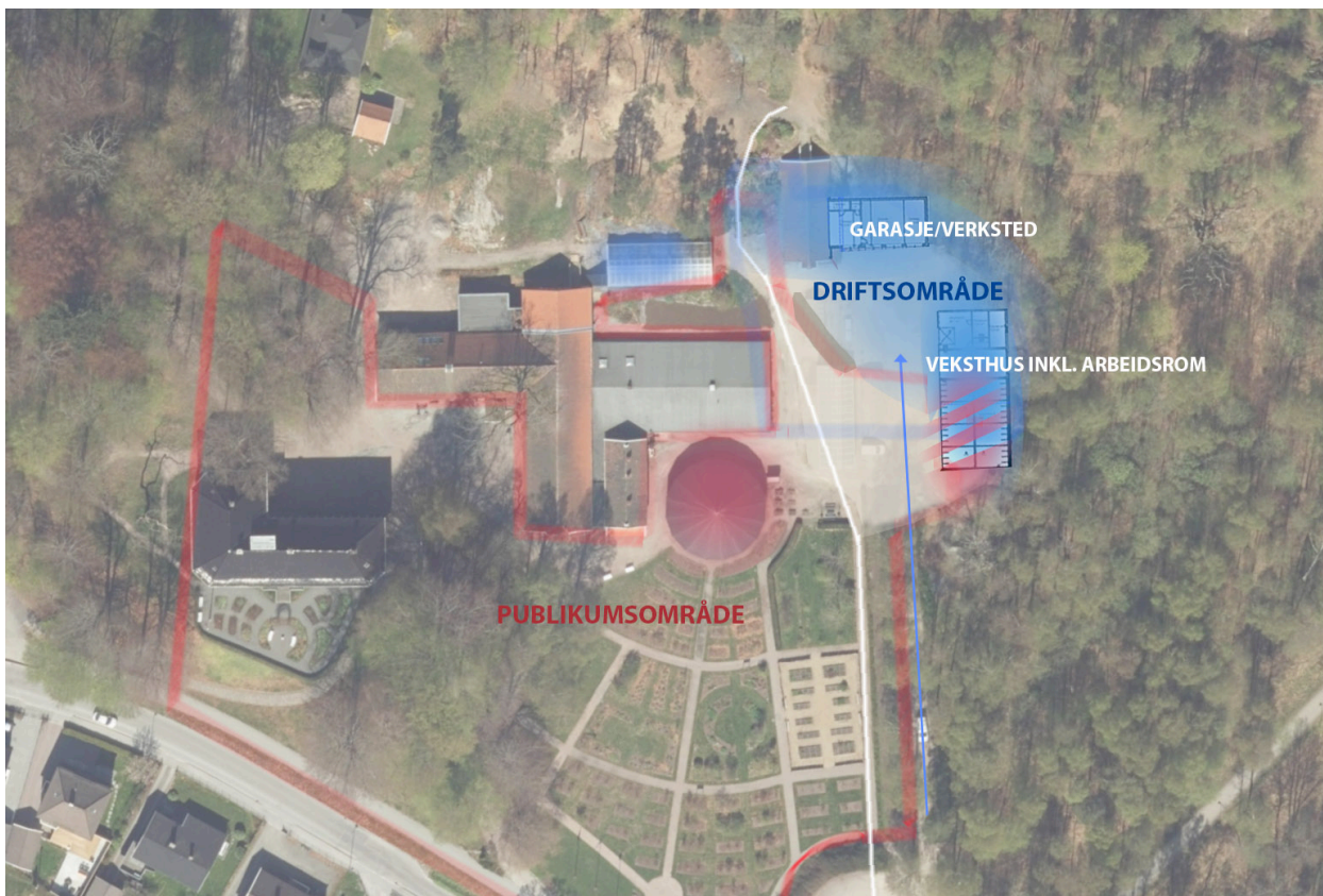
FIG. 2: FREMTIDIG ORGANISERING

Det er lagt opp til å skape en intuitiv forståelse av skille mellom utvendig publikumsareal og utvendig driftsområde. Den sørlige delen av veksthuset (overvintringsdel) vil ha god kobling til et publikumsområde (kalt Ridetorget). I sommerhalvåret vil dette arealet kunne benyttes til arrangementer for publikum.