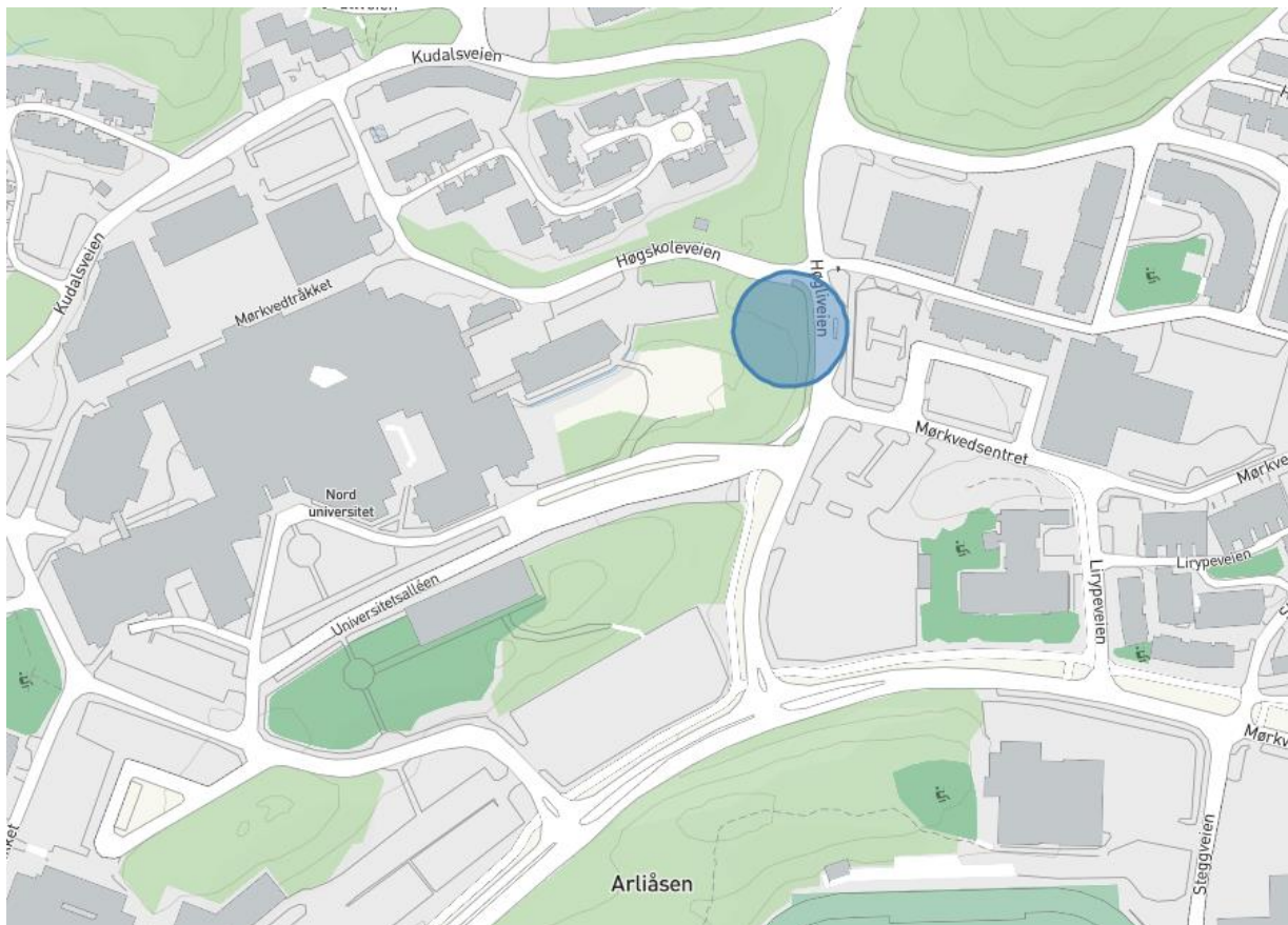
Området som vurderes for snuplass og holdeplass.