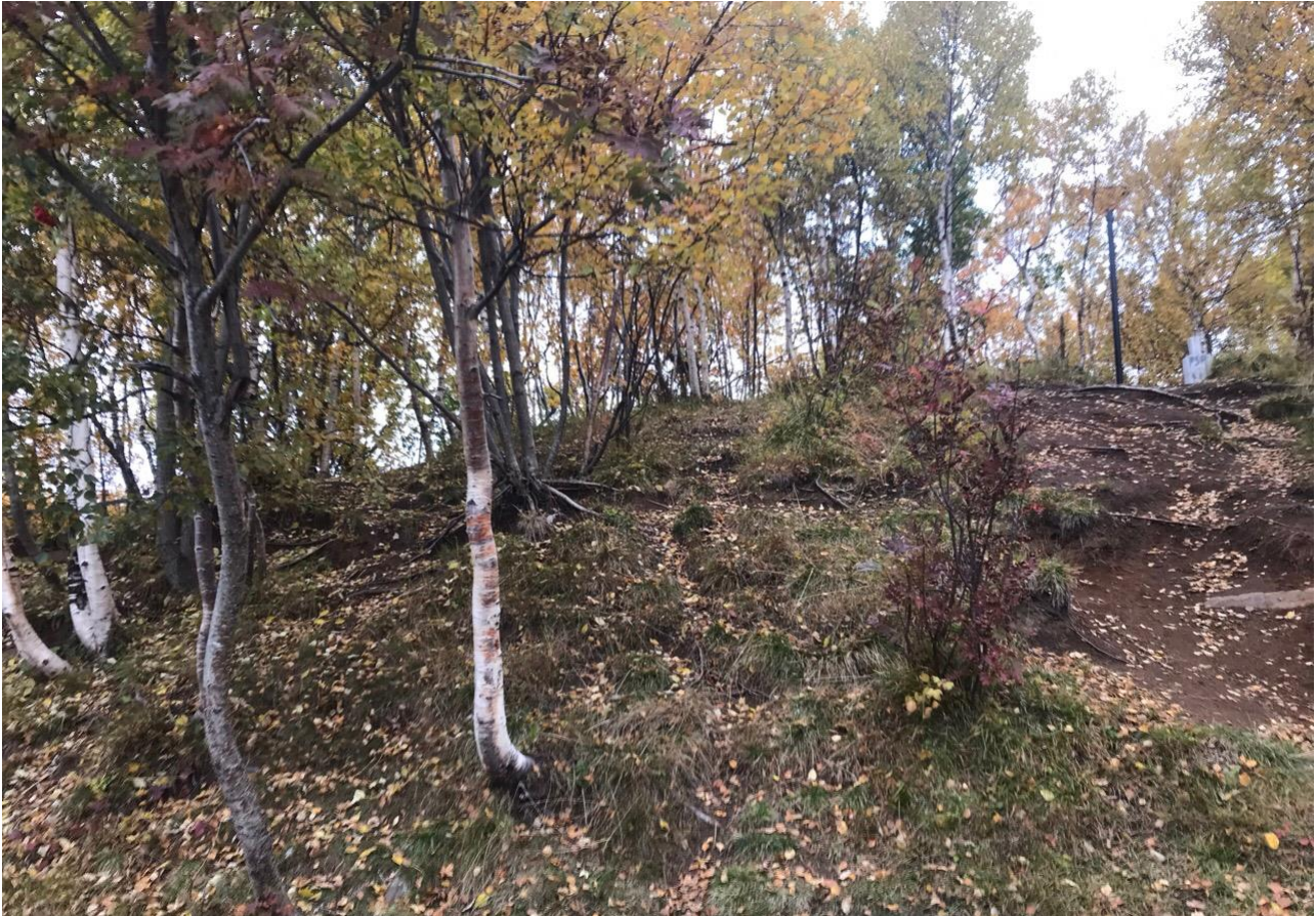
Figur 2: Ung svak berlyn-lågurt bjørkeskog.