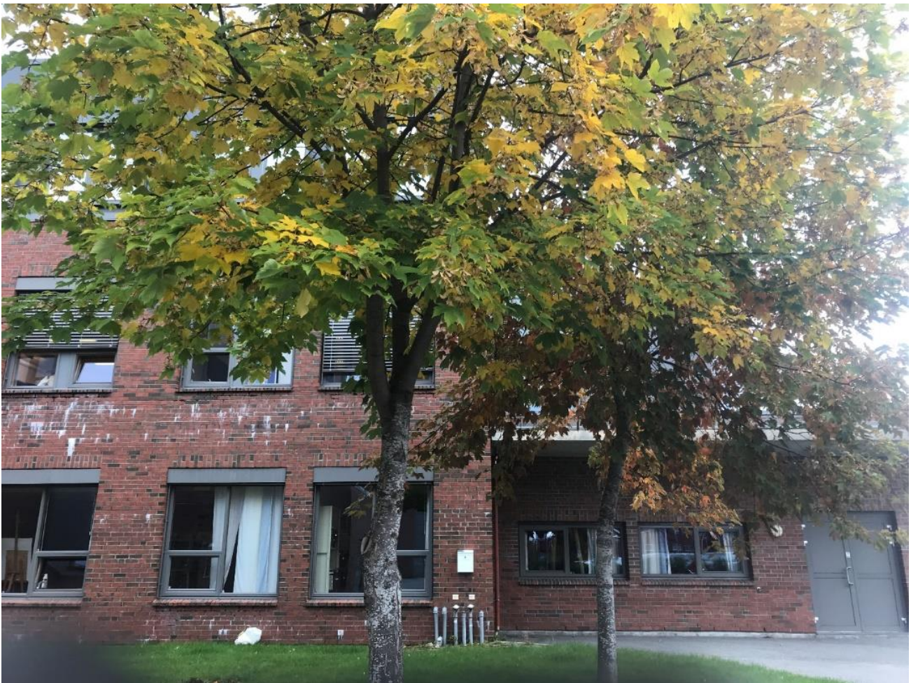
Figur 10: Fremmedarten platanlønn (SE) plantet i parkareale.

Platanlønn (Figur 10) er vurdert som en fremmedart med svært høy risiko fordi den har stort invasjonspotensiale og høy økologisk effekt (Fremmedartslista 2018). Fremmedarten er vurdert til å ha lav spredningsrisiko ved massehåndtering fordi den har en høy frøproduksjon (Miljødirektoratet 2018). Ønskes det å bekjempe denne fremmedarten kan det gjøres ved nedkutting av trærne og kutting av nye skudd for å unngå spredning til omkringliggende skog.