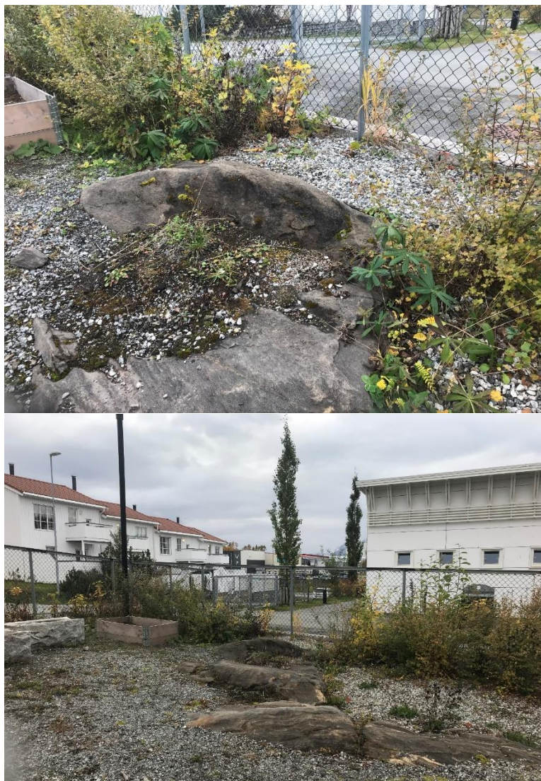
Figur 9: Fremmedarten hagelupin (SE) har startet å kolonisere en bakhage i Studentongan barnehage.

Hagelupin er vurdert til å ha svært høy risiko fordi den har stort invasjonspotensiale og gir en høy økologisk effekt (Fremmedartslista 2018). Arten har en stor frøproduksjon, men kan også spres med jordstengler. Fremmedarten er også vurderer til å være en høyrisikoart ved massehåndtering grunnet stor frøproduksjon og det anbefales derfor at tiltak igangsettes for å fjerne fremmedarten (Miljødirektoratet 2018). Tiltak som jevnlig klipping/luking kan gjøre at planten ikke får tid til å blomstre og sette frø, og bestanden holdes i sjakk. Luking bør skje før blomstring. Blomstrede plantedeler bør sendes til forbrenning eller kompostering (60 grader i minst tre uker). Massene er mest sannsynlig infisert med frø og gjenbruk av massene bør bare skje om de brukes i arealer som blir jevnlig skjøttet (f.eks plen) (Miljødirektoratet 2018). Området i studentbarnehagen er preget av åpne masser som lett kan bli dominert av hagelupin om ikke tiltak igangsettes (Figur 9).