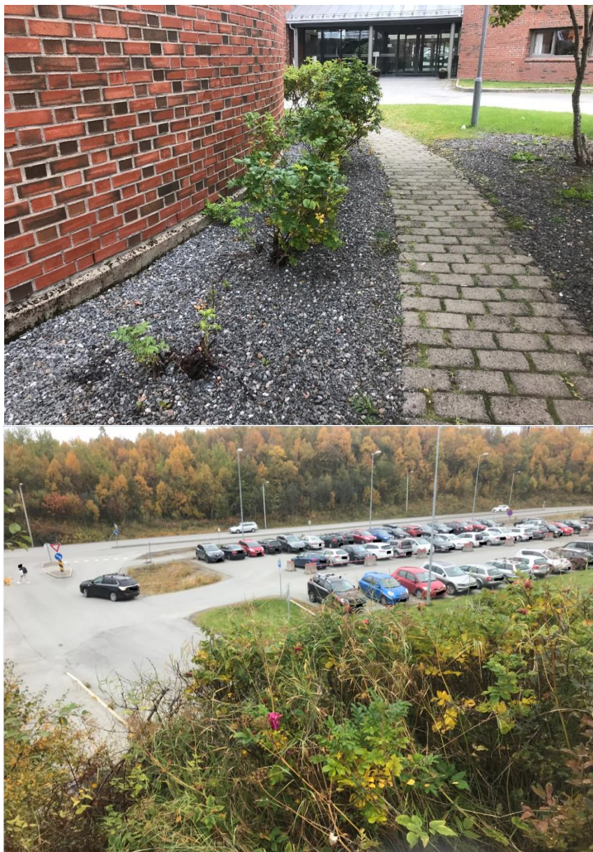
Figur 12: Fremmedarten rynkerose (SE) plantet i bed.

Rynkerose (Figur 12) er vurdert som en fremmed art med svært høy risiko fordi den har stort invasjonspotensiale og høy økologisk effekt (Fremmedartslista 2018). Arten spres både seksuelt og vegetativt. For eksempel spres nypene med vann og fugl. Nypene er seiglivet og kan flyte i vann opp til 40 uker. Rynkerose har også en hurtigvoksende stengel som kan vokse 5-7 meter på et år. Fremmedarten er også vurder til å være en høyrisikoart ved massehåndtering og det anbefales derfor at tiltak igangsettes om man ønsker å fjerne fremmedarten og øke det biologiske mangfold på eiendommen (Miljødirektoratet 2018). Tiltak som klipping, fjerning av nyper og sprøyting av nye skudd anbefales da.