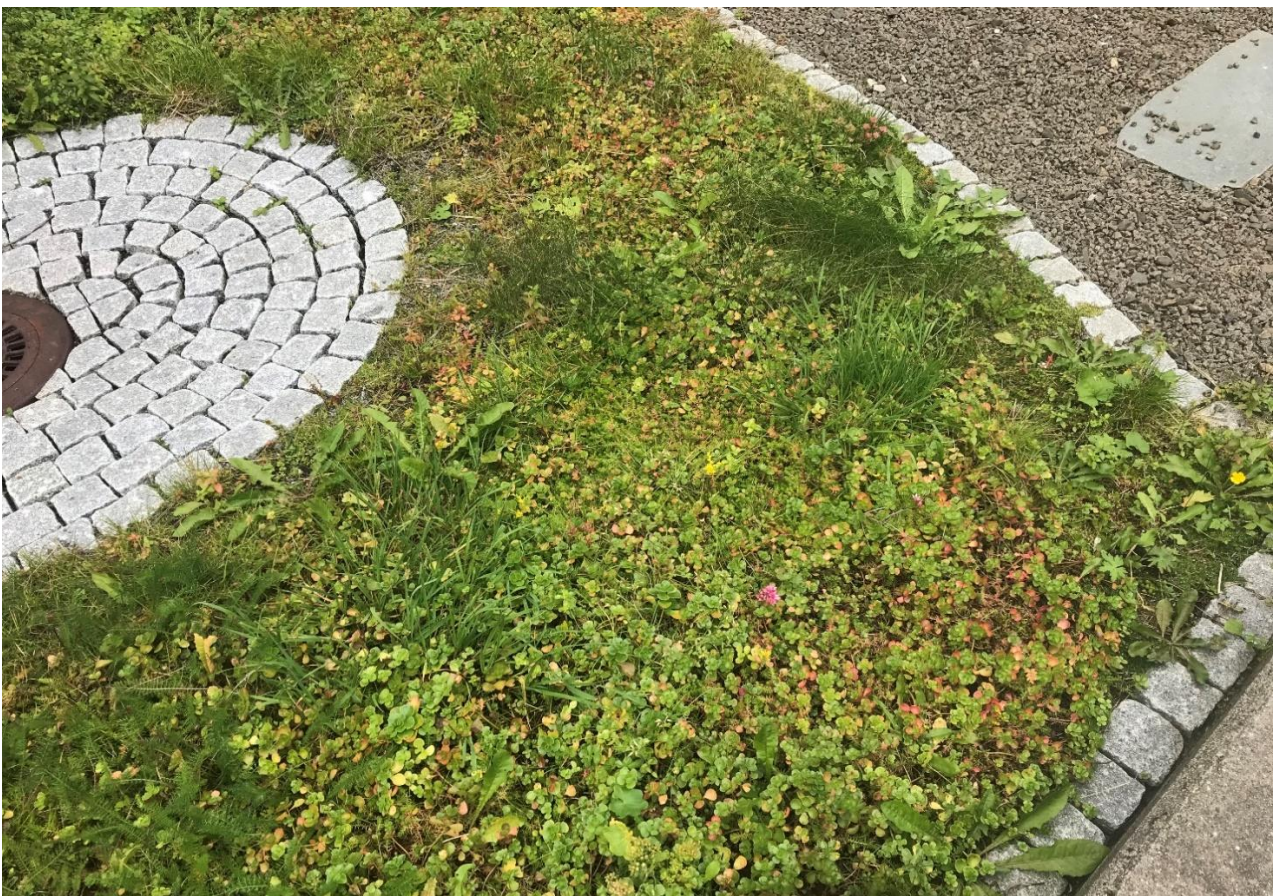
Figur 8: Fremmedarten gravbergknapp (SE) plantet i bed som sedum-matte.

Gravbergknapp (Figur 8) er vurdert til å ha svært høy risiko fordi den har stort invasjonspotensiale og gir en høy økologisk effekt (Fremmedartslista 2018). Fremmedarten er vurdert til å ha lav spredningsrisiko ved massehåndtering fordi den først og fremst spres vegetativt (Miljødirektoratet 2018). For arter med lav spredningsrisiko ved massehåndtering er ikke tiltak alltid nødvendig, men i dette tilfellet bør det vurderes for å øke det biologiske mangfoldet på eiendommen. Ønskes det å bekjempe denne fremmedarten kan det gjøres ved lusing og oppgraving av røtter. Ønskes det å ha en sedum-matte finnes det mange norske sedum-alternativer man kan plante istedenfor, som for eksempel bitterbergknapp, hvitbergknapp, broddbergknapp osv.