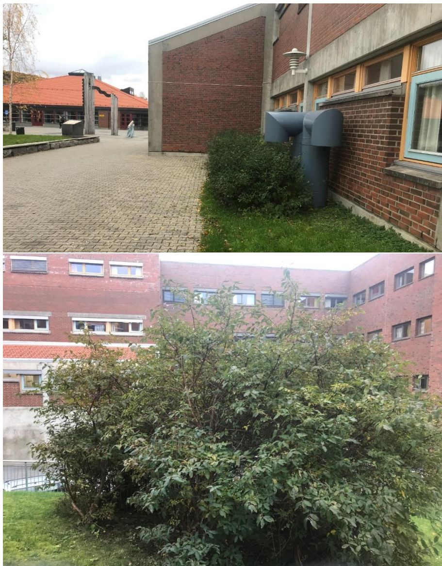
Figur 6: Fremmedarten blåleddved (SE) i hekk.

Blåleddved er vurdert som en fremmed art med svært høy risiko fordi den har stort invasjonspotensiale og gir en middels økologisk effekt (Fremmedartslista 2018). Fremmedarten er vurdert til å lav spredningsrisiko ved massehåndtering fordi den først og fremst spres med bær som blir fraktet med fugl og smågnagere (Miljødirektoratet 2018). Blåleddveden på denne eiendommen er plantet som hekk (Figur 6). Det er ikke ulovlig å ha fremmede arter på tomte, men man har et ansvar for å unngå spredning av fremmede arter. Hvis formålet er å bekjempe denne fremmede arten kan den kuttes ned eller sprøytes slik at den ikke rekker å produsere bær. Eventuelt nye skudd bør da også klippes.