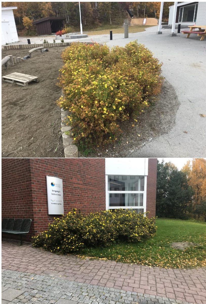
Figur 7: Fremmedarten buskmure (PH) plantet i bed.

Buskmure er vurdert til å ha potensielt høy risiko siden den har stort invasjonspotensiale, men ingen kjent økologisk effekt (Fremmedartslista 2018). Denne fremmedarten har ikke blitt risikovurdert med tanke på massehåndtering (Miljødirektoratet 2018). Buskmuren på denne eiendommen er plantet i bed (Figur 7). Buskmure har en beskjeden spredning av frø, men de har potensiale for å spres med dyr (Fremmedartslista 2018). Det er ikke ulovlig å ha fremmede arter på tomta, men man har et ansvar for å unngå spredning av fremmede arter. Annet tiltak en vanlig klipping er ikke nødvendig, men om det likevel ønskes å fjerne fremmedarten kan dette gjøres ved kutting og eventuelt sprøyting.