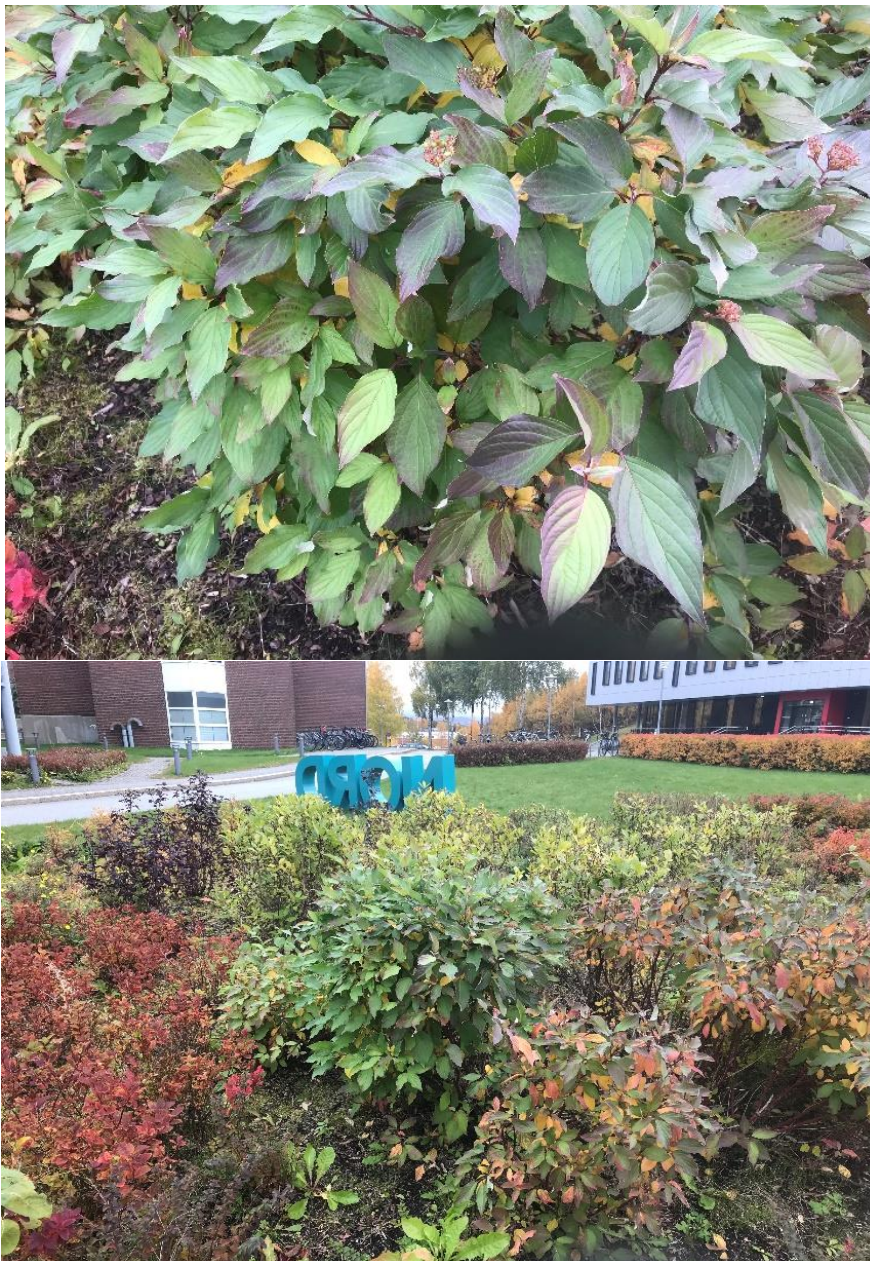
Figur 4: Fremmedarten alaskakornell (SE) i bed.

Alaskakornell (Figur 4) er vurdert som en fremmed art med svært høy risiko fordi den har stort invasjonspotensiale og gir en middels økologisk effekt (Fremmedartslista 2018). Fremmedarten er vurdert til å lav spredningsrisiko ved massehåndtering fordi den først og fremst spres med bær som blir fraktet med fugl eller klonal vekst der grenene kan slå rot (Miljødirektoratet, 2018). Om man ikke ønsker å ha fremmedarten på eiendommen kan den bekjempes ved kutting og eventuelt sprøyting.