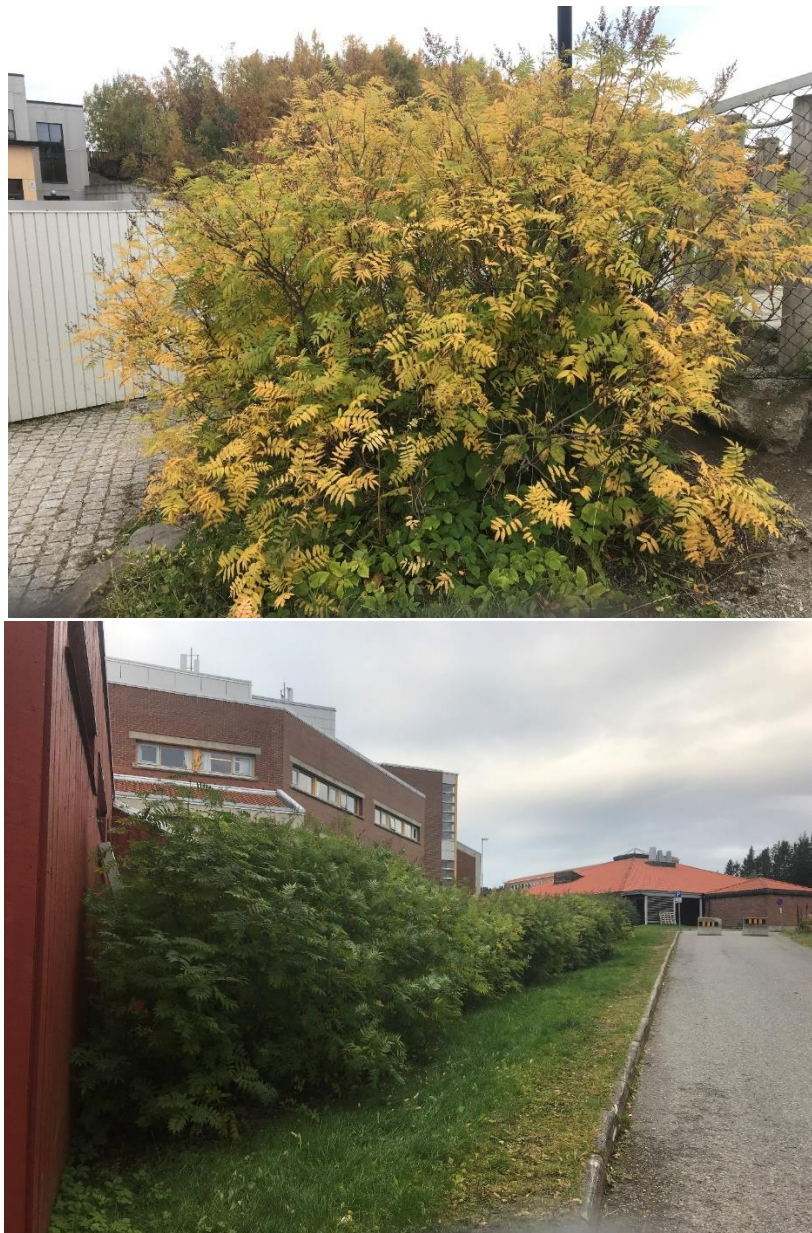
Figur 11: Fremmedarten rognspirea (SE) plantet i hekk.

Rognspirea (Figur 11) er vurdert som en fremmedart med svært høy risiko fordi den har stort invasjonspotensiale og gir en middels økologisk effekt (Fremmedartslista 2018). Fremmedarten er vurdert til å lav spredningsrisiko ved massehåndtering fordi den først og fremst spres ved klonal vekst med rotskudd (Miljødirektoratet, 2018). Den har også en krypende jordstengel og kan formere seg med frø. Ønskes det å bekjempe denne fremmedarten kan det gjøres ved kutting og oppgraving av røtter, eventuelt sprøyting.