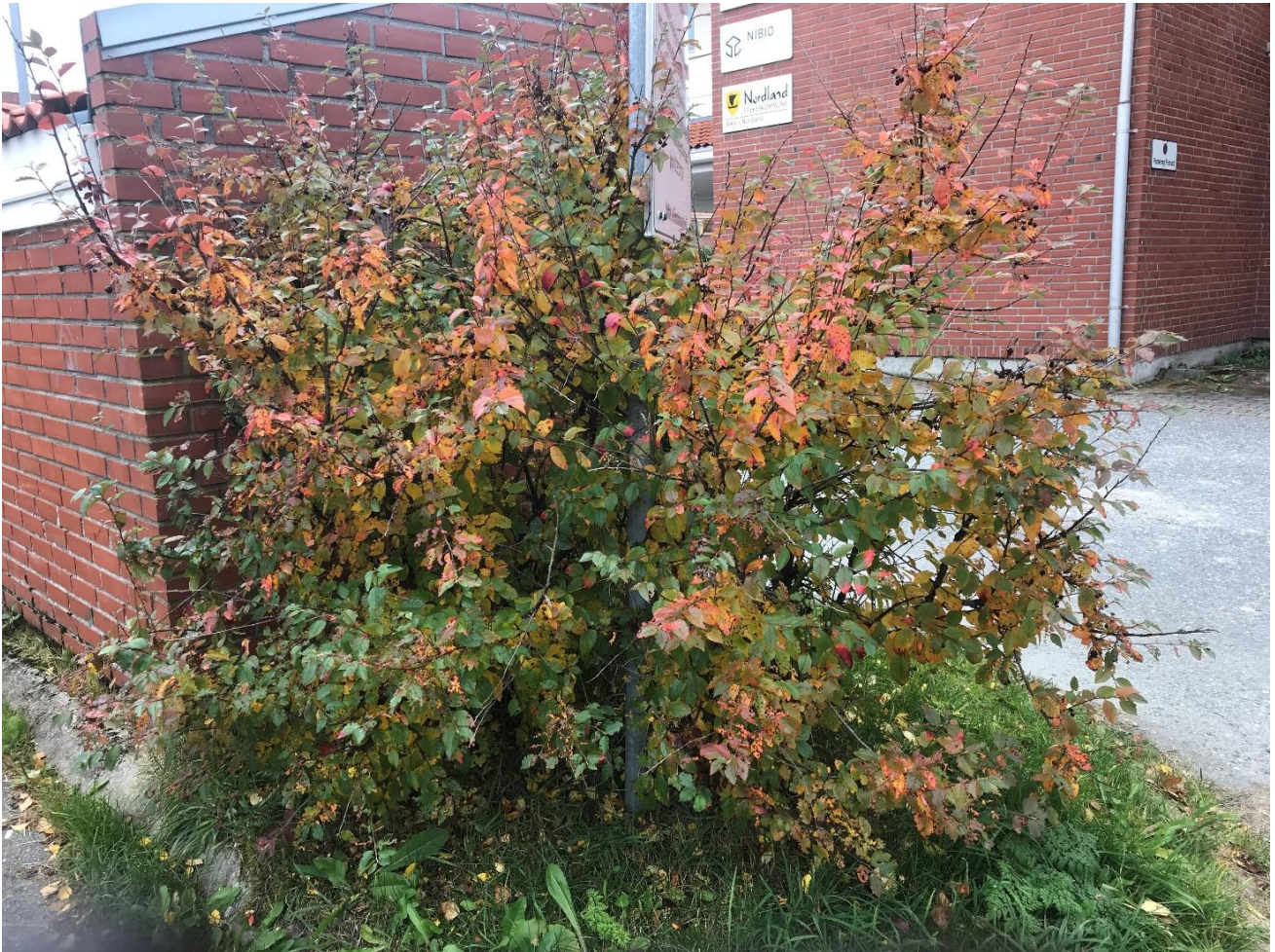
Figur 5: Blankmispel (SE) som prydbusk ved parkeringsplass.

Blankmispel (Figur 5) er vurdert som en fremmedart med svært høy risiko fordi den har stort invasjonspotensiale og høy økologisk effekt (Fremmedartslista 2018). Fremmedarten er vurdert til å ha lav spredningsrisiko ved massehåndtering fordi den først og fremst spres med fugl (Miljødirektoratet 2018). Ønskes det å bekjempe denne fremmedarten kan det gjøres ved kutting og oppgraving av røtter, eventuelt sprøyting. Det er lurt å være klar over at frøene kan overleve opptil 5 år i frøbank, så jorden bør eventuelt også varmebehandles for å unngå ny tilvekst.