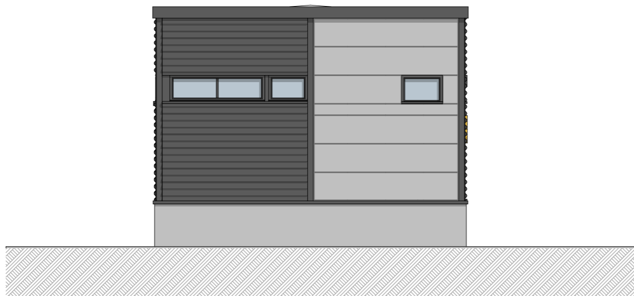
1:100 Fasade Nordøst