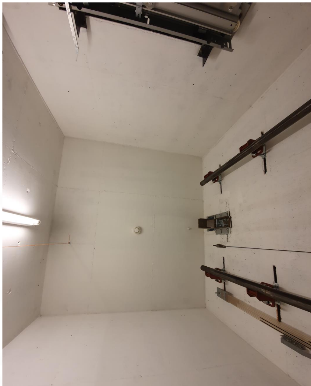
2.01.5 Sjakt – taket er av betong. Tilbyder må etablere kroker og sertifisering