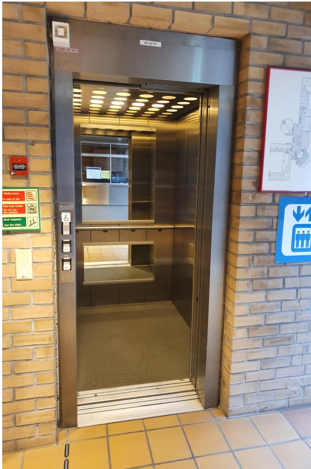
2.01.1 Oversiktsbilde – heis