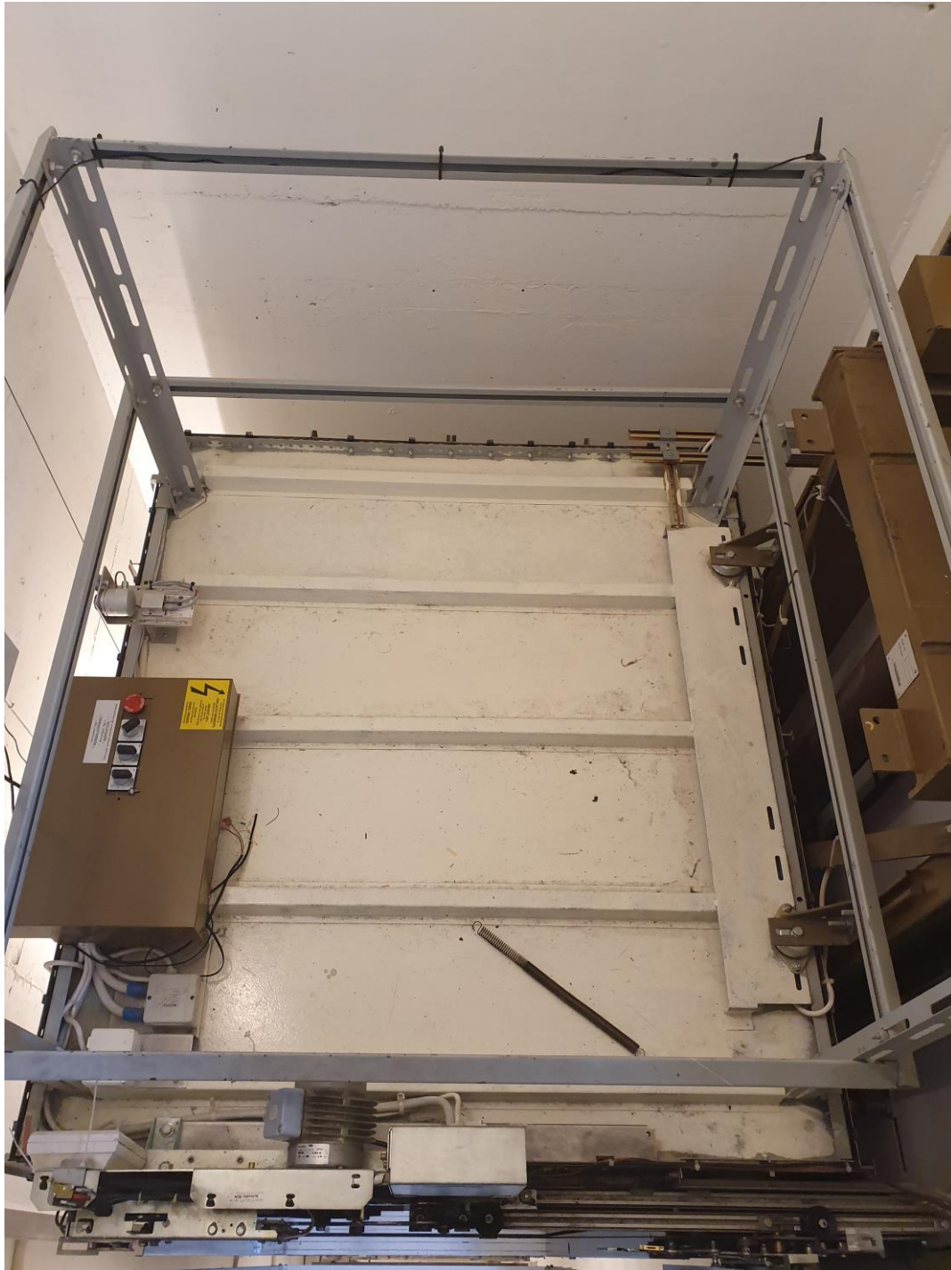
2.01.4 Heistaket- Alt skal fjernes og leveres til godkjent deponi.