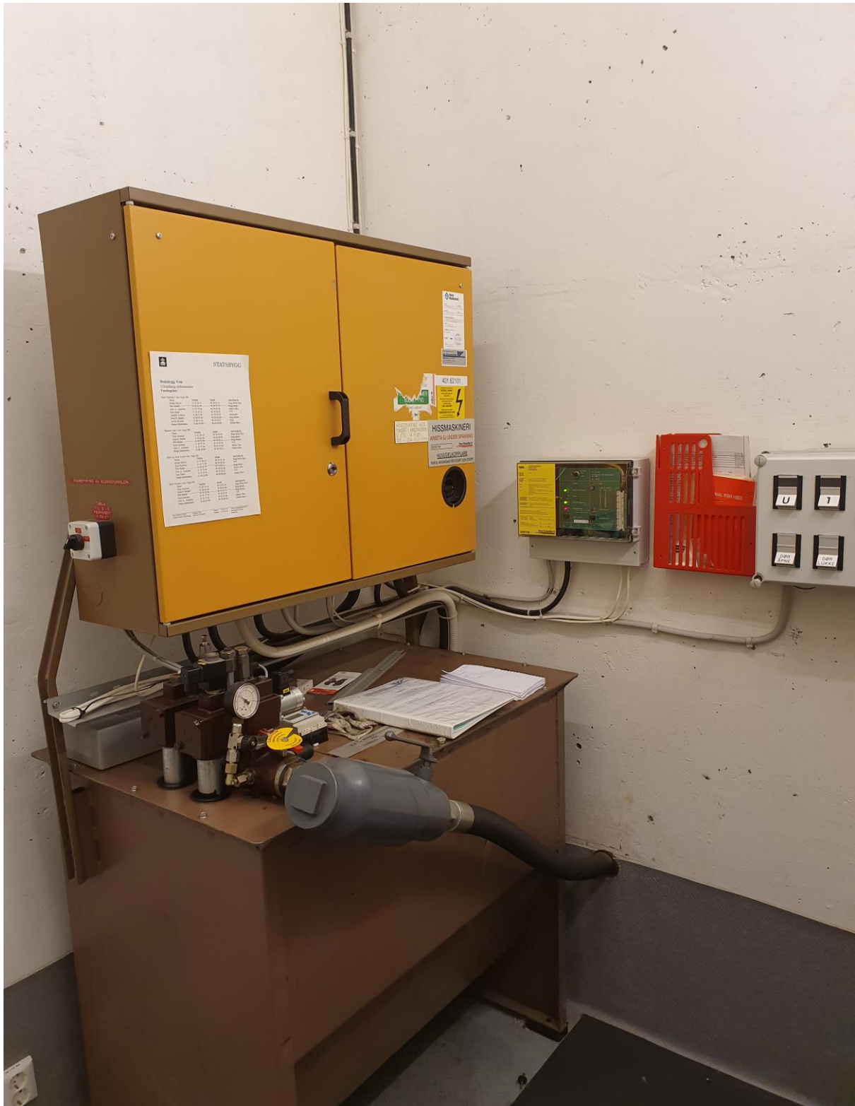
2.01.3 Maskinskap – Plassert i nederste plan. Alt heisteknisk utstyr skal fjernes. Eventuelle brantnetting mellom sjakt og maskinrom skal også etableres etter demontering.