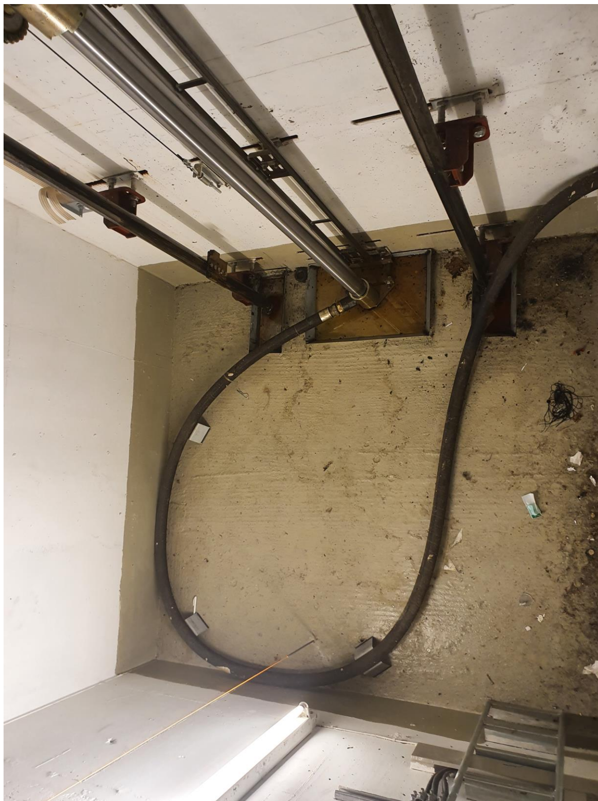
2.01.2 Gruven – Tilbyder må støpe og male gulvet med oljebestandig maling. Innfesting av festejern er med ankerskinner på vegg.