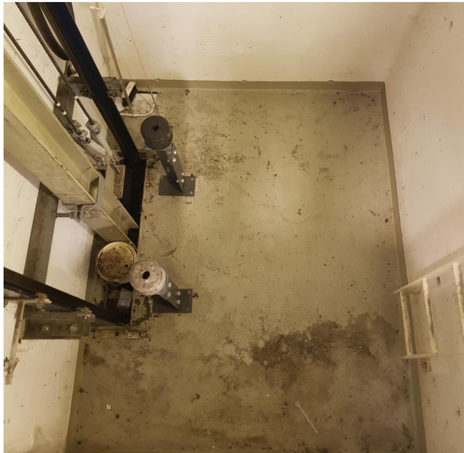
2.01.3 Gruven – Tilbyder må male gulvet med oljebestandig maling. Om skader i maling må tilbyder male på nytt