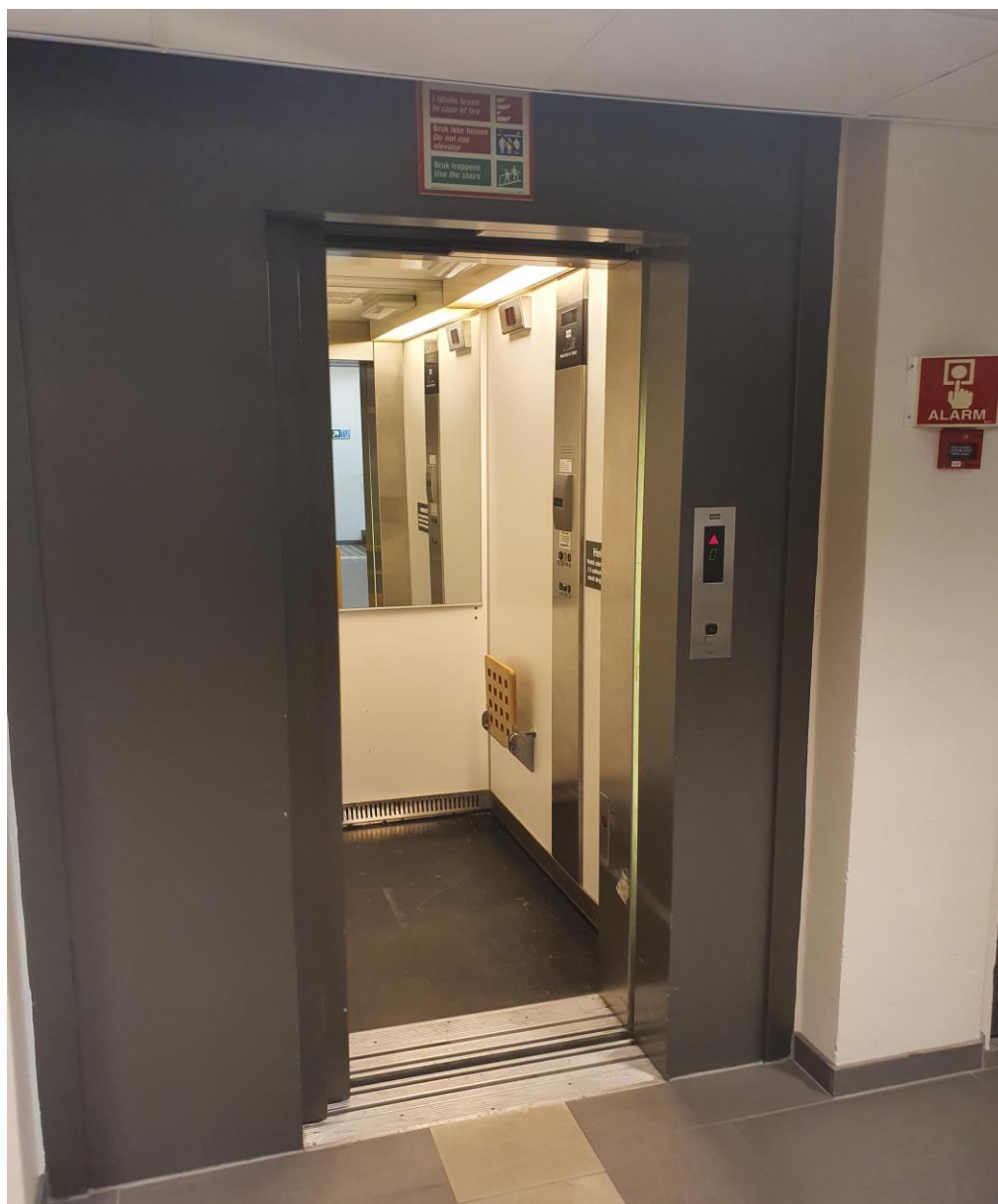
2.01.7 Bilde av heiskupe med dører på 800mm lysåpning. Leveres minst med lysåpning på 900mm