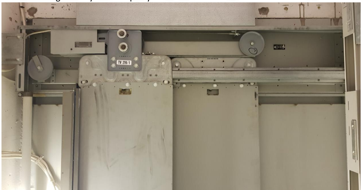
2.01.4 Sjaktdører – innfestning. Om det må utføres bygningsmessig i prosjektet skal det være inkludert.