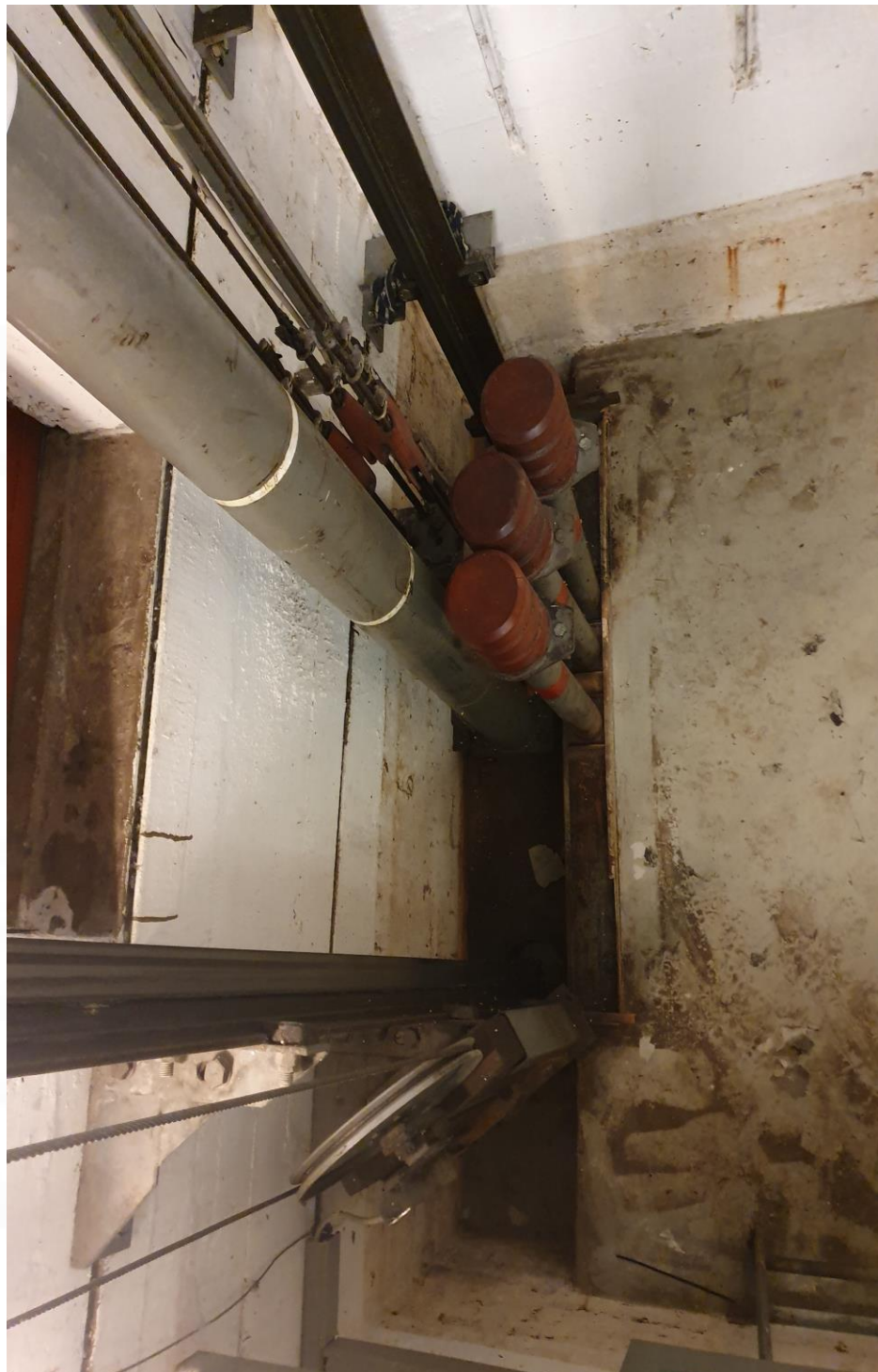
2.01.2 Gruven – Tilbyder må støpe og male gulvet med oljebestandig maling. Spring i betong må dekkes og skal være inkludert.