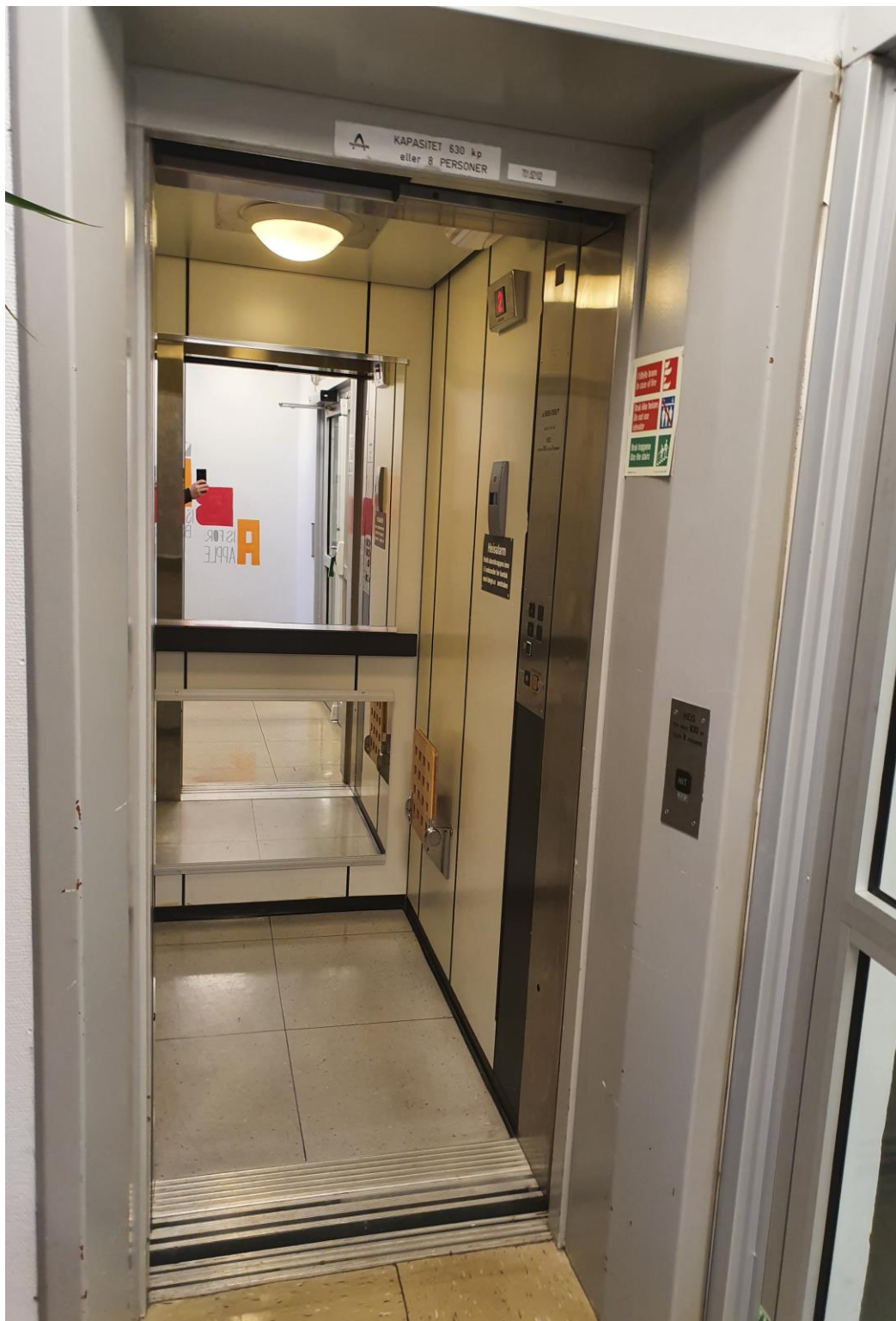
2.01.1 Oversiktsbilde – heis