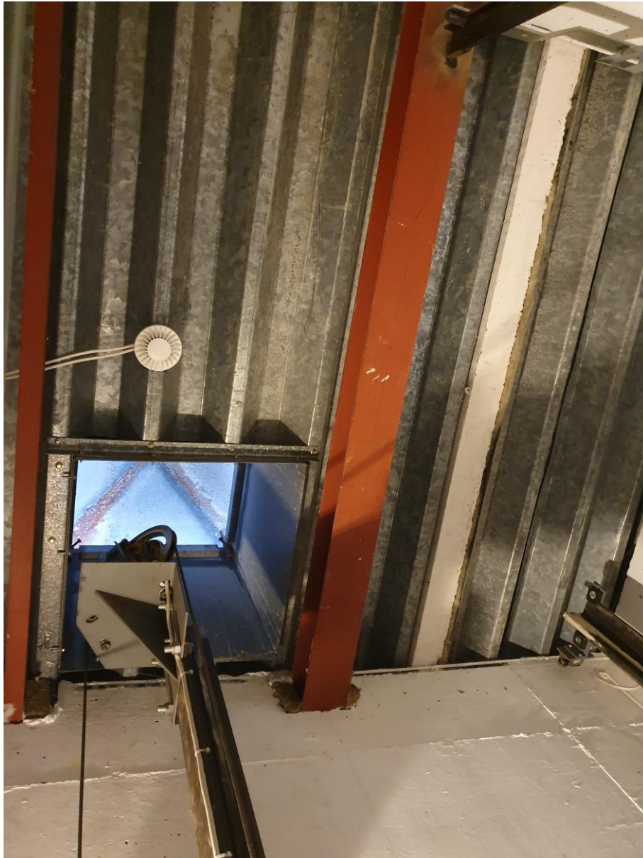
2.01.6 Bilde av sjakttoppen. Tilbyder må ha inkludert innfestning av kroker og sertifisering.