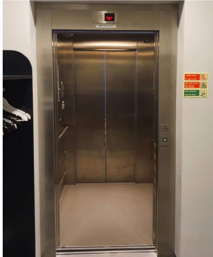
2.01.1 Oversiktsbilde – heis