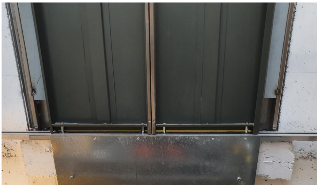
2.01.7 Bilde av innfesting av sjaktdør sett fra innsiden.