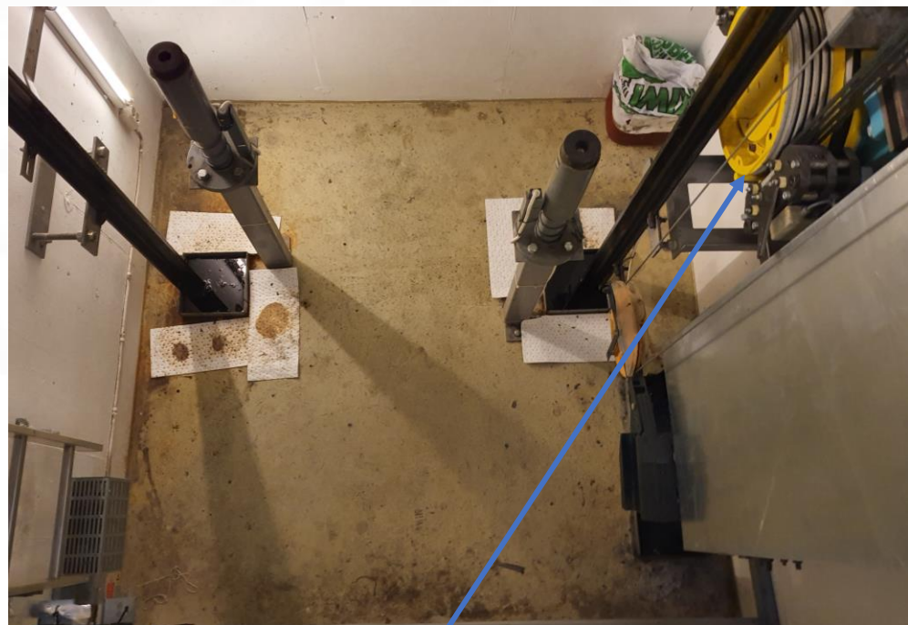
2.01.2 Gruven – Tilbyder må støpe og male gulvet med oljebestandig maling. Motor er plassert på høyre side