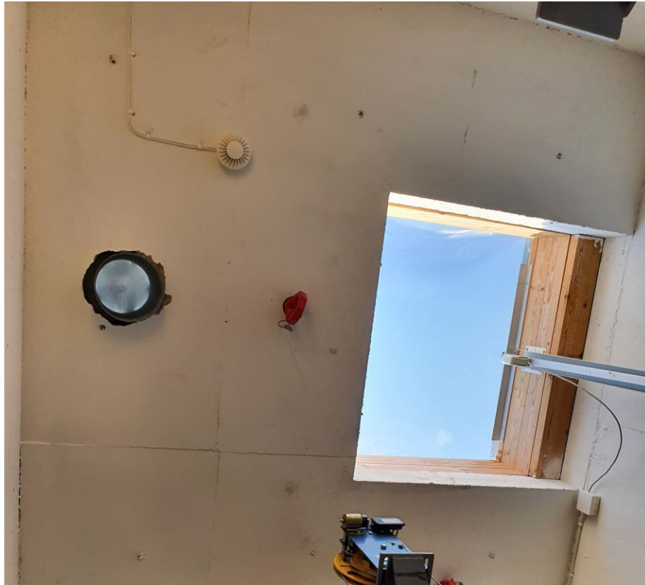
2.01.5 Sjakt – taket har litt spesiell løsning. Tilbyder må ordne løsning med kroker og oppheng.