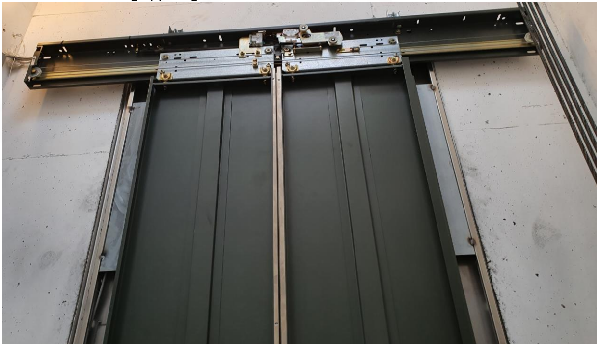
2.01.6 Bilde av sjaktdør på innsiden av sjakten. Innfesting med ekspansjonsbolter.