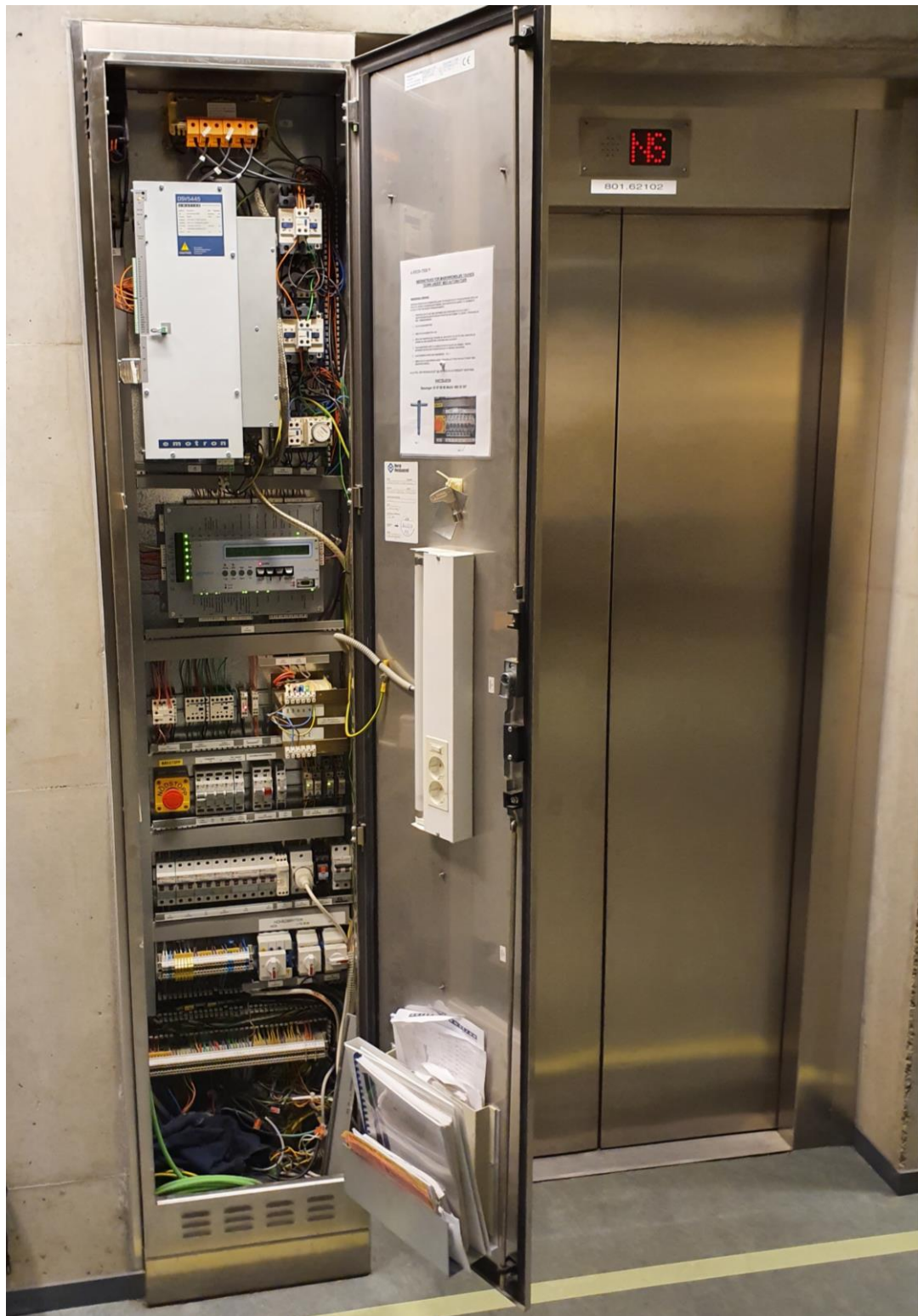
2.01.3 Maskinskap – Plassert i nederste plan. Om nytt skap plasseres annet sted må tilbyr tette igjen eksisterende hull i mellom maskinskap og sjakt.