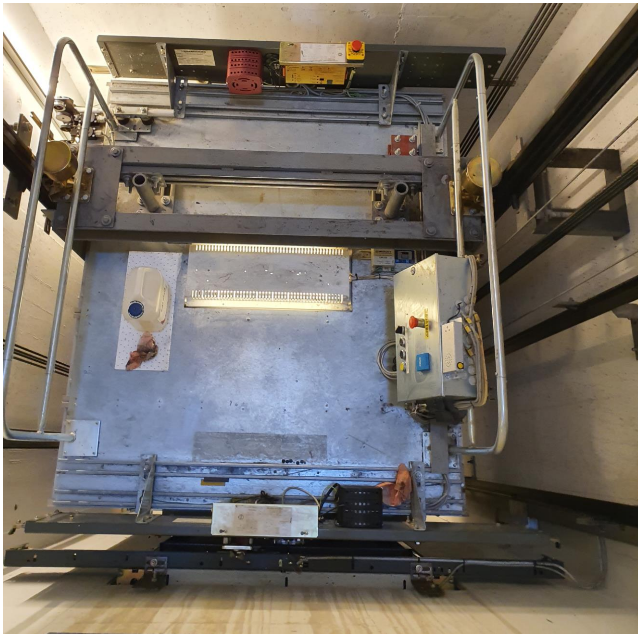
2.01.4 Heistaket- Alt skal fjernes og leveres til godkjent deponi.