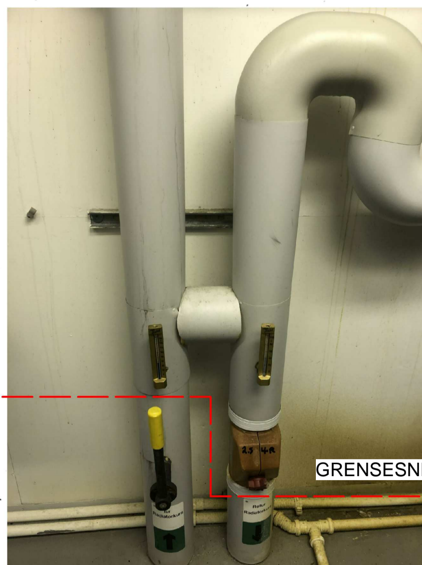
GRENSESNIITT RIVING VARMERØR

ALT I TEKNISK ROM RIVES UTENOM KANALER MERKET GRØNT .