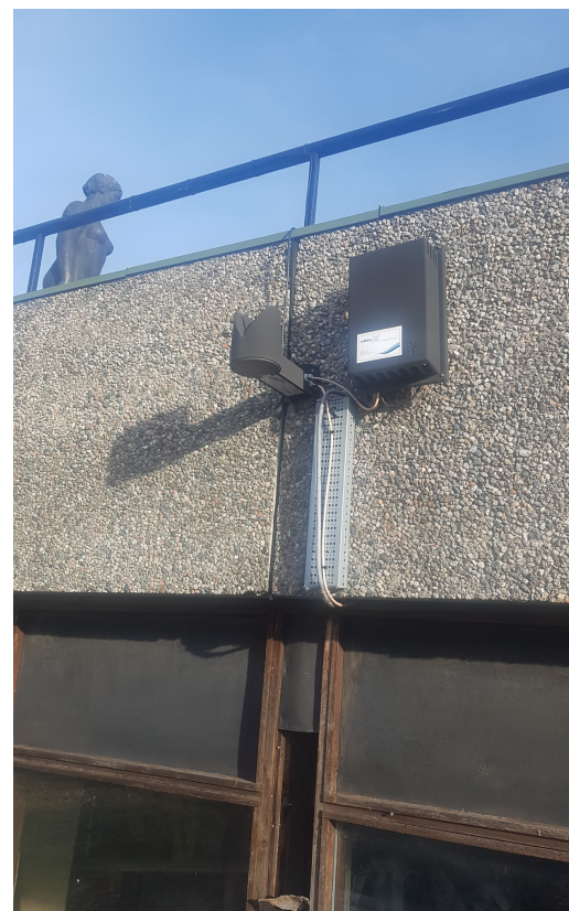
Bilde 8 - Snøføler for fotball