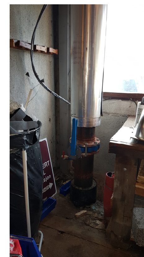
Bilde 10 - Rør for varme fellesretur

Bilder av forhold som må opprettholdes i byggeperioden og hensyn som må tas jfr. beskrivelse og tegning NIH_10M_OC_A_2_23_101: