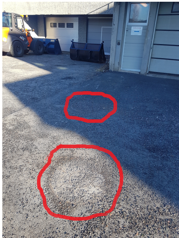
Bilde 11 – Kum eksisterende oljeutskiller