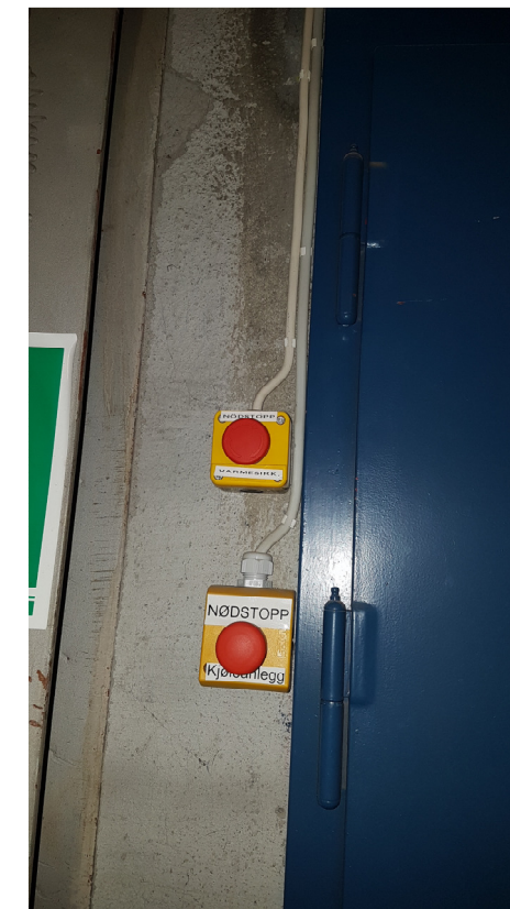
Bilde 5 - Nødstop for Bandyanlegg