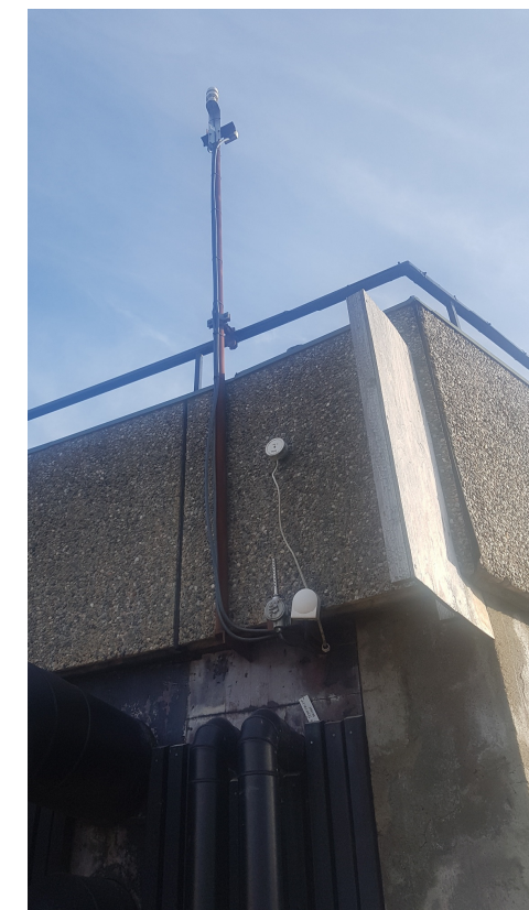
Bilde 9 - Temp.føler for bandy og fotball