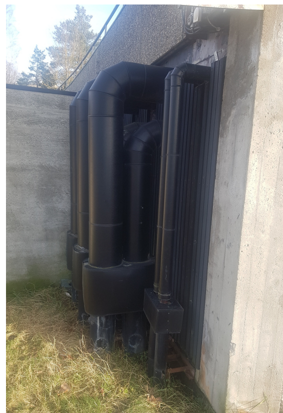
Bilde 7 - Rør for saltlake utvendig