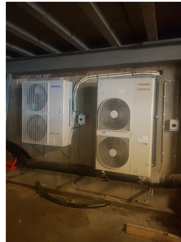
Bilde 4 - Utedeler til kjøling i serverrom