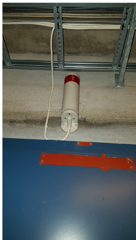
Bilde 6 - Varsellampe for alarm ammoniakk