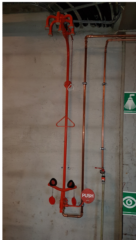
Bilde 1 - Vann og nøddusj