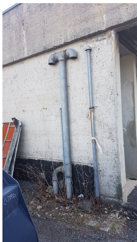
Bilde 15 - Lufting for eksisterende oljeutskiller

Ny dør er prosjektert med høyde 2100mm. Det betyr at den vil stikke opp over underkant rør, men slår inn i bakenforliggende garasje