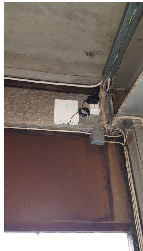
Bilde 2- Alarmsender