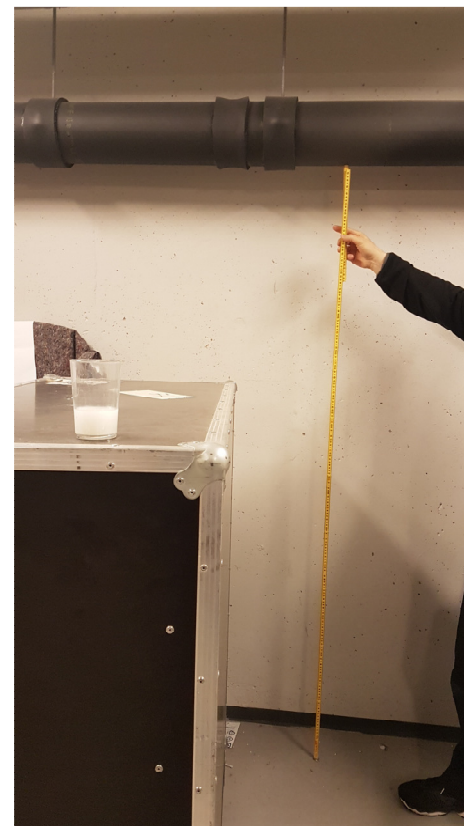
Bilde 13 - Høyde fra gulv til underkant rør ved fremtidig dør til garasje-verksted