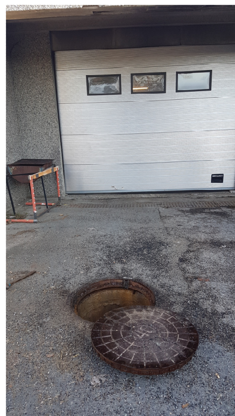
Bilde 12- Sandfang kum for utvendig drensrenne