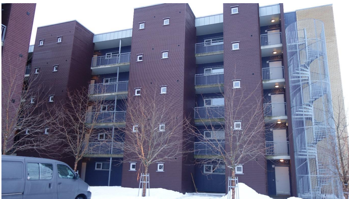
Deler av Fasade Nordvest (Bygg 2)