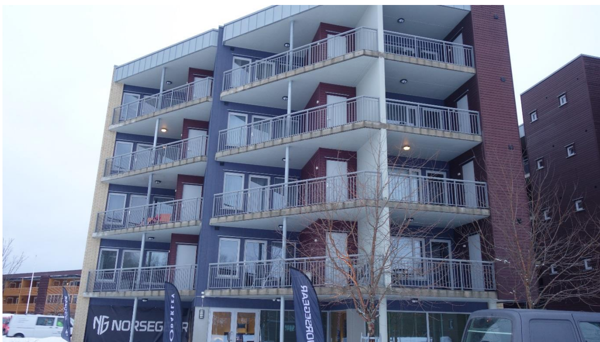
Bilde 4 : Fasade Sydvest del 2 (Bygg 2)