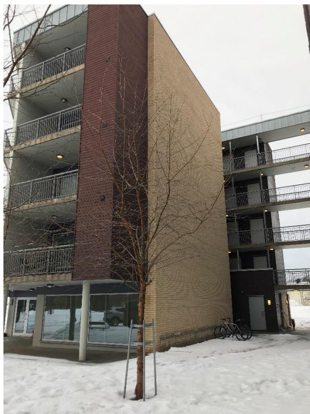
Fasade Sydøst på andre del av bygget (Bygg 1)