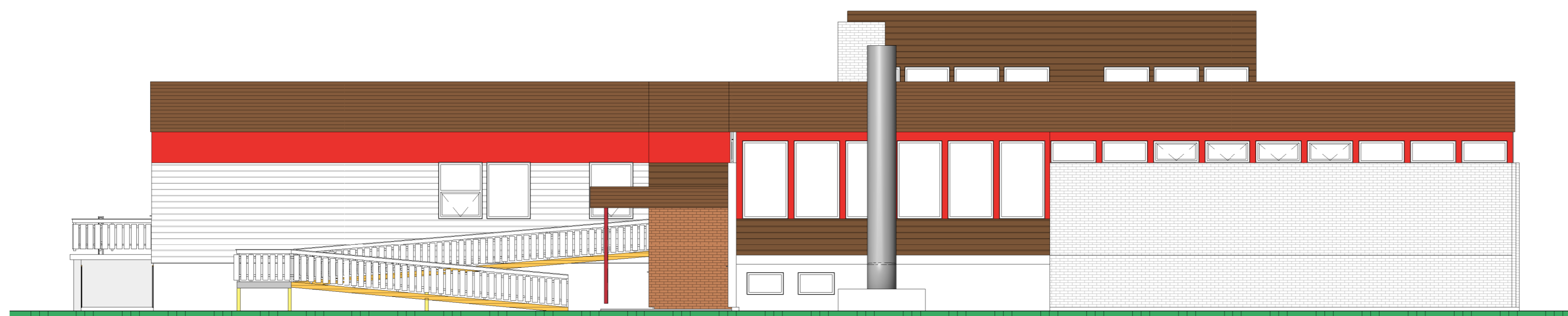
Fasade mot nordvest