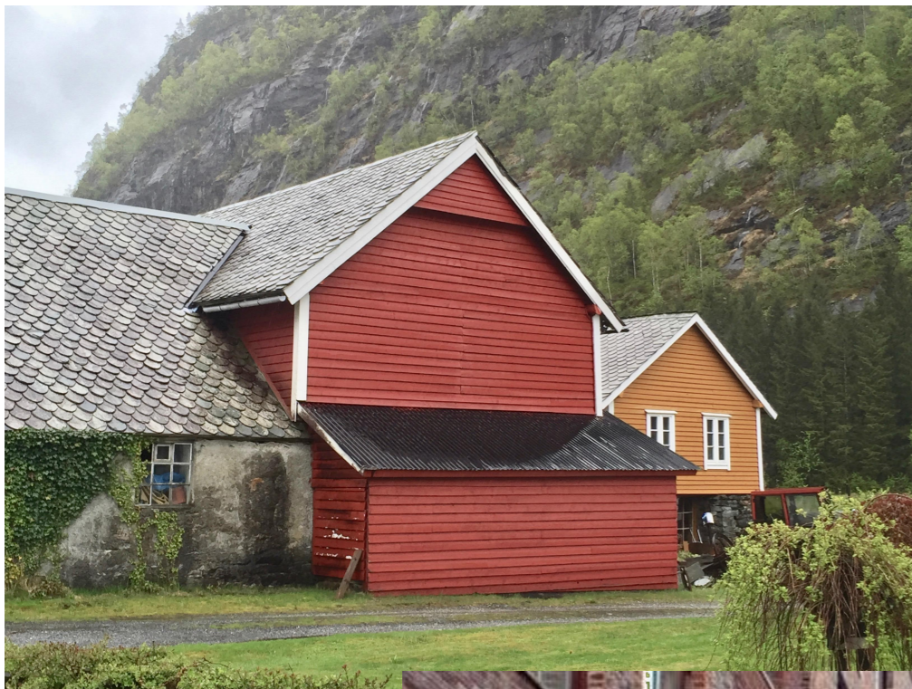
Låve i Mo, Skifertak og liggende vestlandspanel