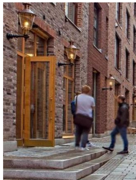
Nygaardsplassen, Frederikstad Dører og vinduer i oljet eik med sparkeplate i messing