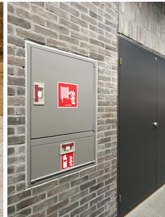
Innfelt brannslangeskap, håndsløkker