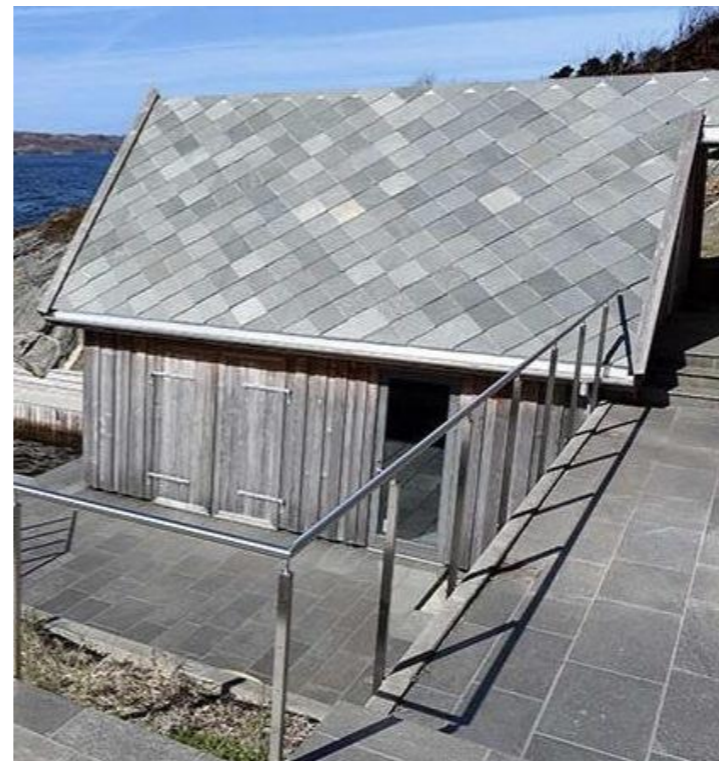
Skifertak med firkantstein