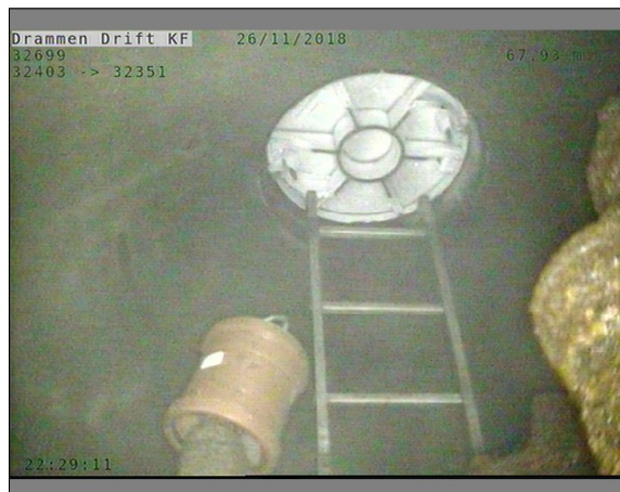
Foto: L32699_32403_32351_26112018_1_21_67,93_D.JPG, 00:24:45 67,93m, Inspeksjon fullført -