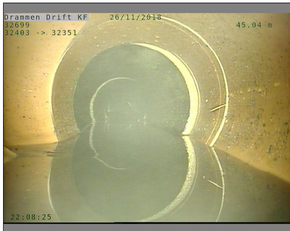
Foto: L32699_32403_32351_26112018_1_9_45,039_D.JPG, 00:13:50 45,04m, Materialendring til Plast