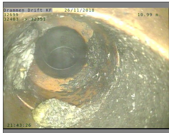
Foto: L32699_32403_32351_26112018_1_4_10,988_D.JPG, 00:04:45 10,99m, Tilkopling Prefabrikkert grenrør. 09 Kl.