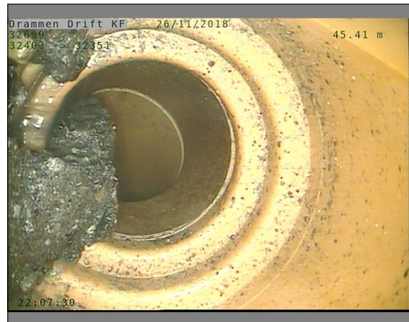
Foto: L32699_32403_32351_26112018_1_9_45,414_D.JPG, 00:13:45 45,41m, Tilkopling Prefabrikkert grenrør. 09 Kl.