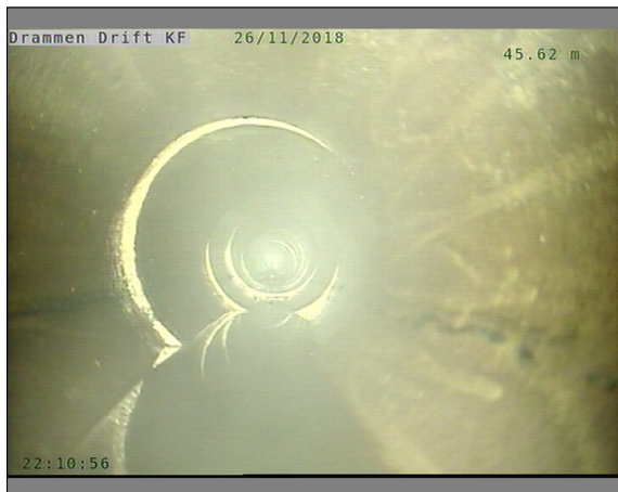
Foto: L32699_32403_32351_26112018_1_11_45,618_D.JPG, 00:14:17 45,62m, Materialendring til leirrør