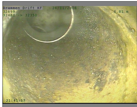
Foto: L32699_32403_32351_26112018_1_2_8,557_D.JPG, 00:02:47 8,56m, Tilkopling Prefabrikkert grenrør. 09 Kl.