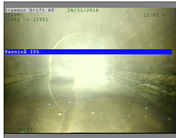
Foto: L32699_32403_32351_26112018_1_6_22,849_D.JPG, 00:08:00 22,85m, Vannivå 15%