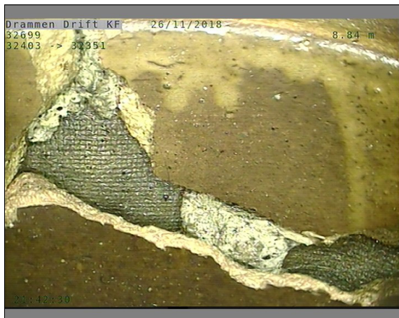
Foto: L32699_32403_32351_26112018_1_3_8,839_D.JPG, 00:03:57 8,84m, Sprukket rør, Rørbiter har løsnet eller mangler/teglstein mangler fra sin opprinnlige posisjon, fra 09 til 03 Kl., Kompleks