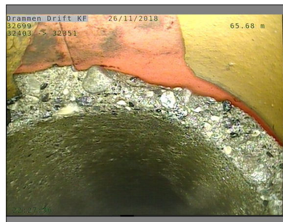
Foto: L32699_32403_32351_26112018_1_20_65,685_D.JPG, 00:23:51 65,68m, Materialendring til Betong