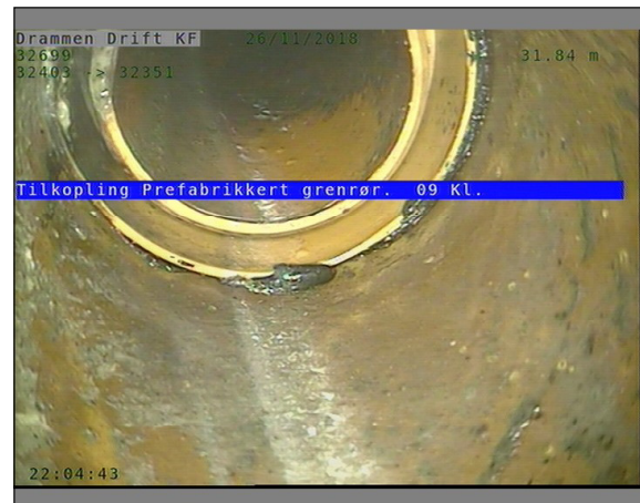
Foto: L32699_32403_32351_26112018_1_8_31,838_D.JPG, 00:11:10 31,84m, Tilkopling Prefabrikkert grenrør. 09 Kl.