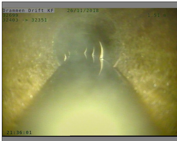
Foto: L32699_32403_32351_26112018_1_1_1,506_D.JPG, 00:00:00 1,51m, Start inspeksjon -