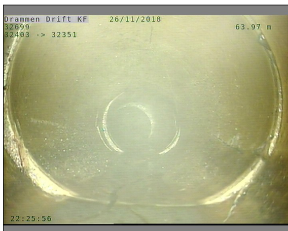
Foto: L32699_32403_32351_26112018_1_19_63,967_D.JPG, 00:23:11 63,97m, Sprukket rør, Rørbiter har løsnet eller mangler/teglstein mangler fra sin opprinnlige posisjon, fra 12 til 12 Kl., Kompleks, Start