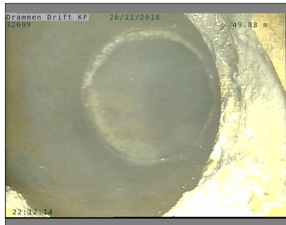
Foto: L32699_32403_32351_26112018_1_12_49,88_D.JPG, 00:15:22 49,88m, Tilkopling Sadelgren med innhugget hull 02 Kl.