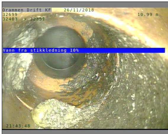
Foto: L32699_32403_32351_26112018_1_5_10,989_D.JPG, 00:04:56 10,99m, Vann fra stikkledning 10%