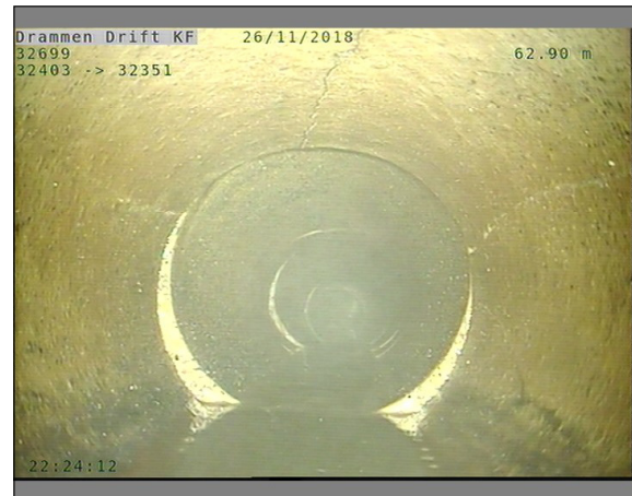
Foto: L32699_32403_32351_26112018_1_18_62,802_D.JPG, 00:22:50 62,8m, Sprukket rør, Rørbiter har løsnet eller mangler/teglstein mangler fra sin opprinnlige posisjon, fra 12 til 12 Kl., Kompleks, Ende