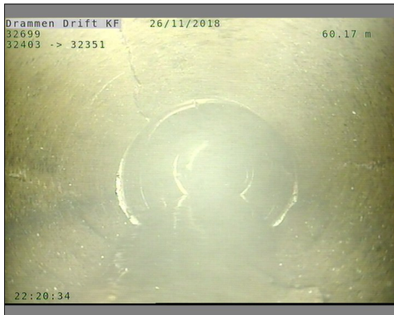
Foto: L32699_32403_32351_26112018_1_17_60,172_D.JPG, 00:20:51 60,17m, Sprukket rør, Rørbiter har løsnet eller mangler/teglstein mangler fra sin opprinnlige posisjon, fra 12 til 12 Kl., Kompleks, Start