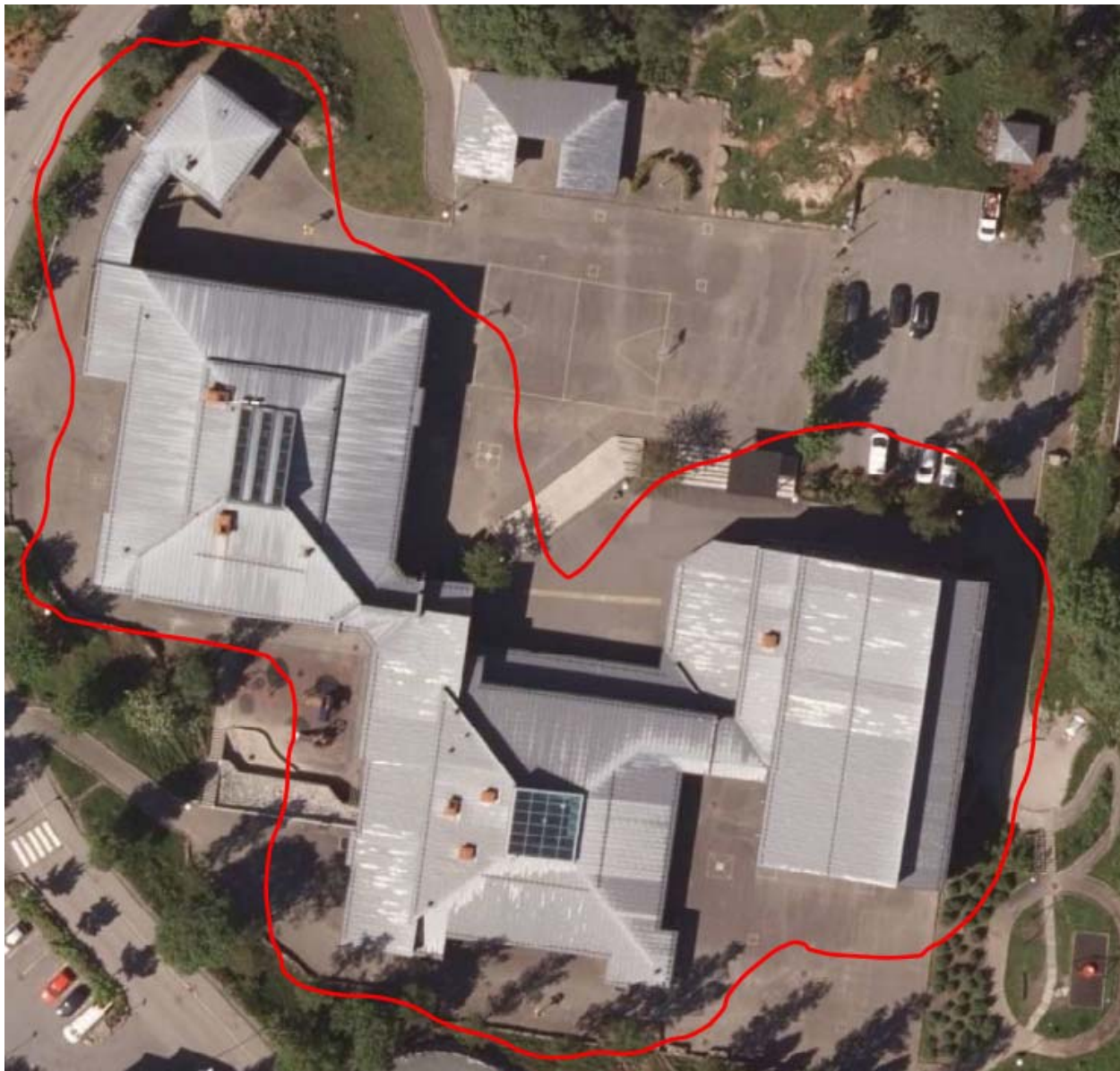
Figur 7 Bygg hvor tak skal skiftes

Arbeider medtatt i denne funksjonsbeskrivelse gjelder alle yttertak som er innenfor rødt omriss på flyfoto under. Dette gjelder tekking, beslagsarbeider, renner og nedløp, takhatter etc.