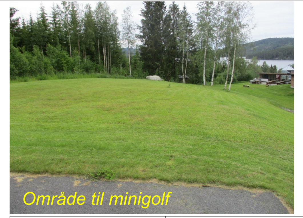
Område til minigolf