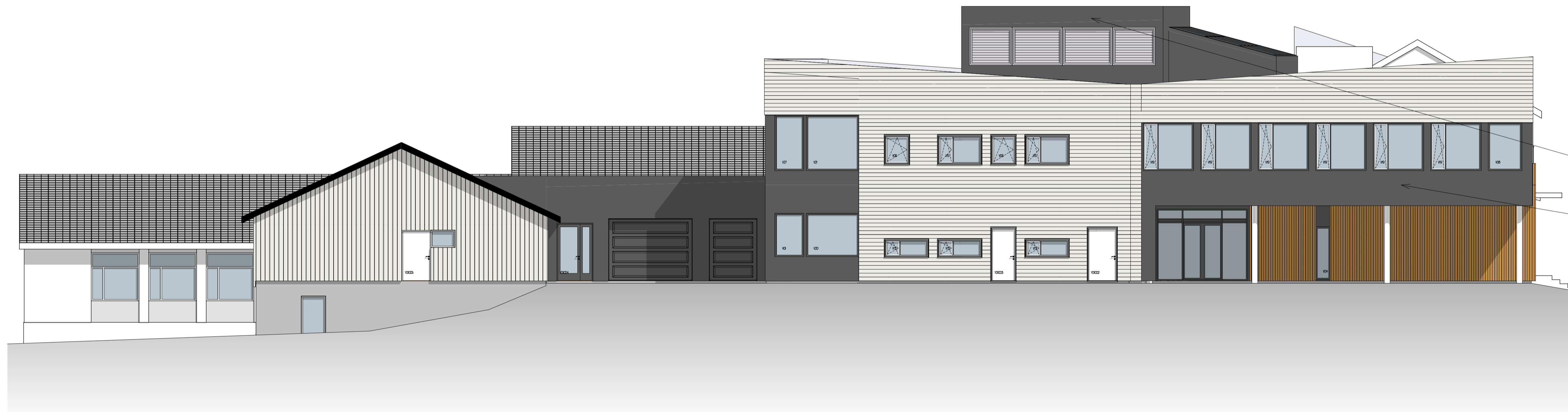
FASADE ØST 1:100