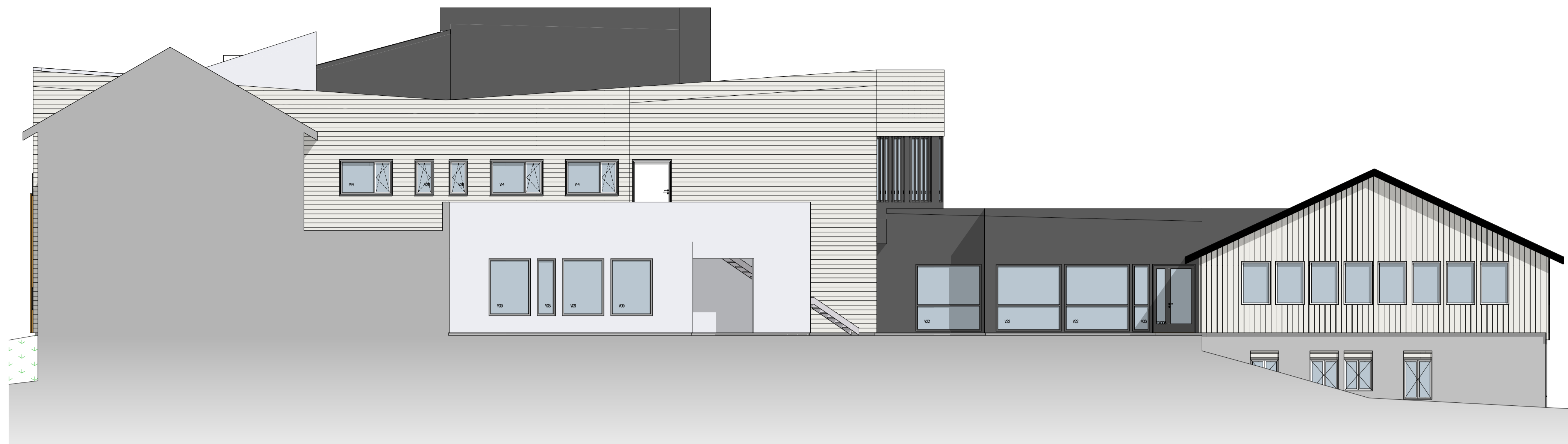
FASADE VEST 1:100