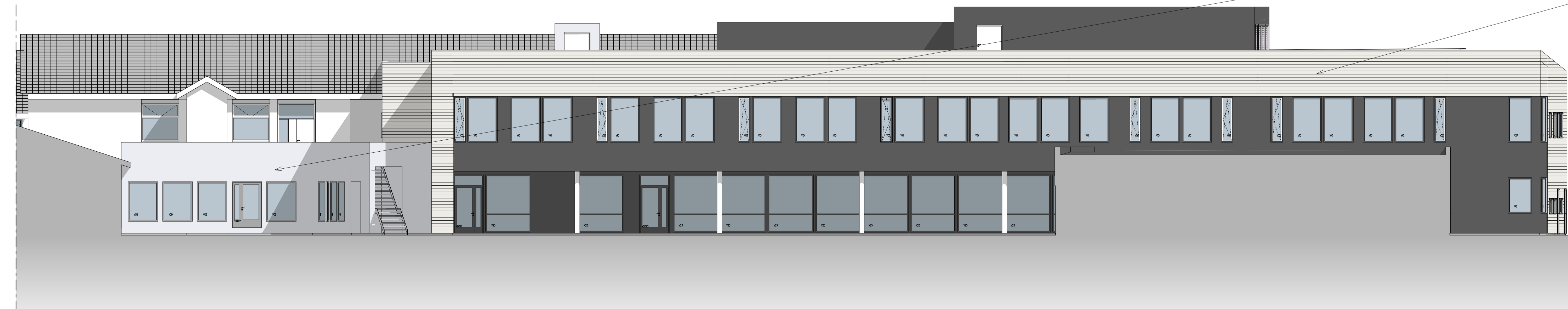
FASADE SØR 1:100