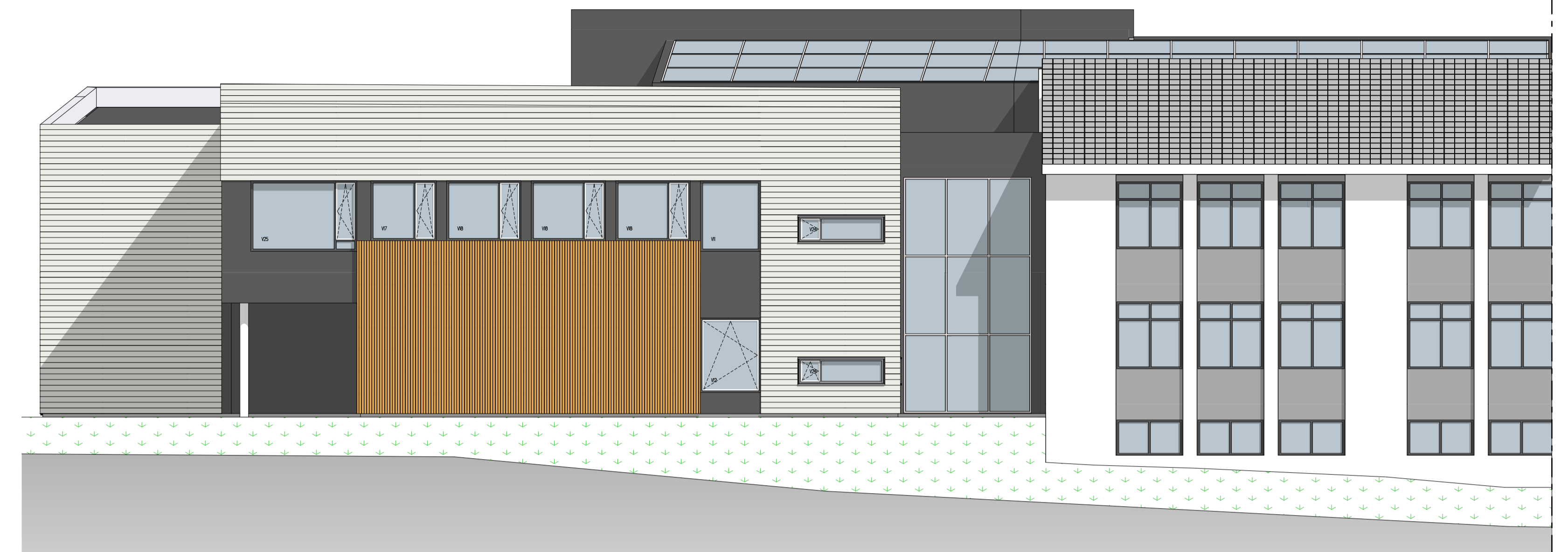
FASADE NORD 1:100