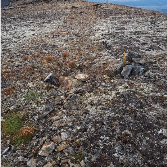
Illustrasjon på område med løsmasser over fjell