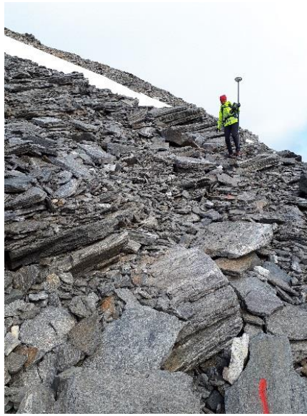
Illustrasjon på område med steinur