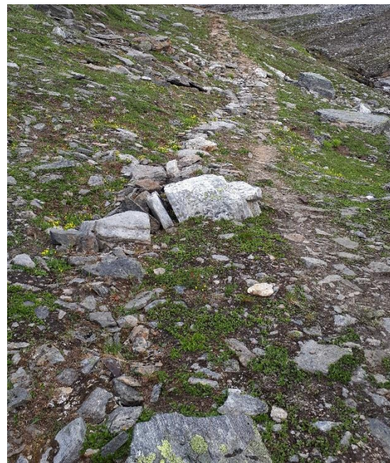
Illustrasjon på område med løsmasse/gressbakke