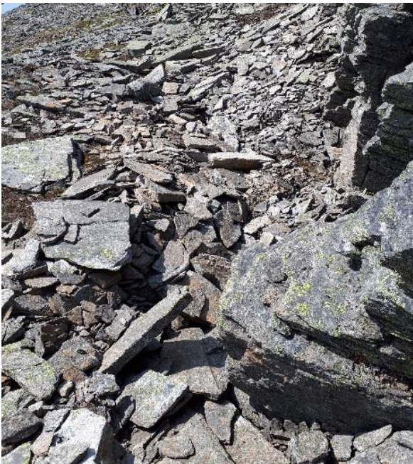
Illustrasjon på område med steinur