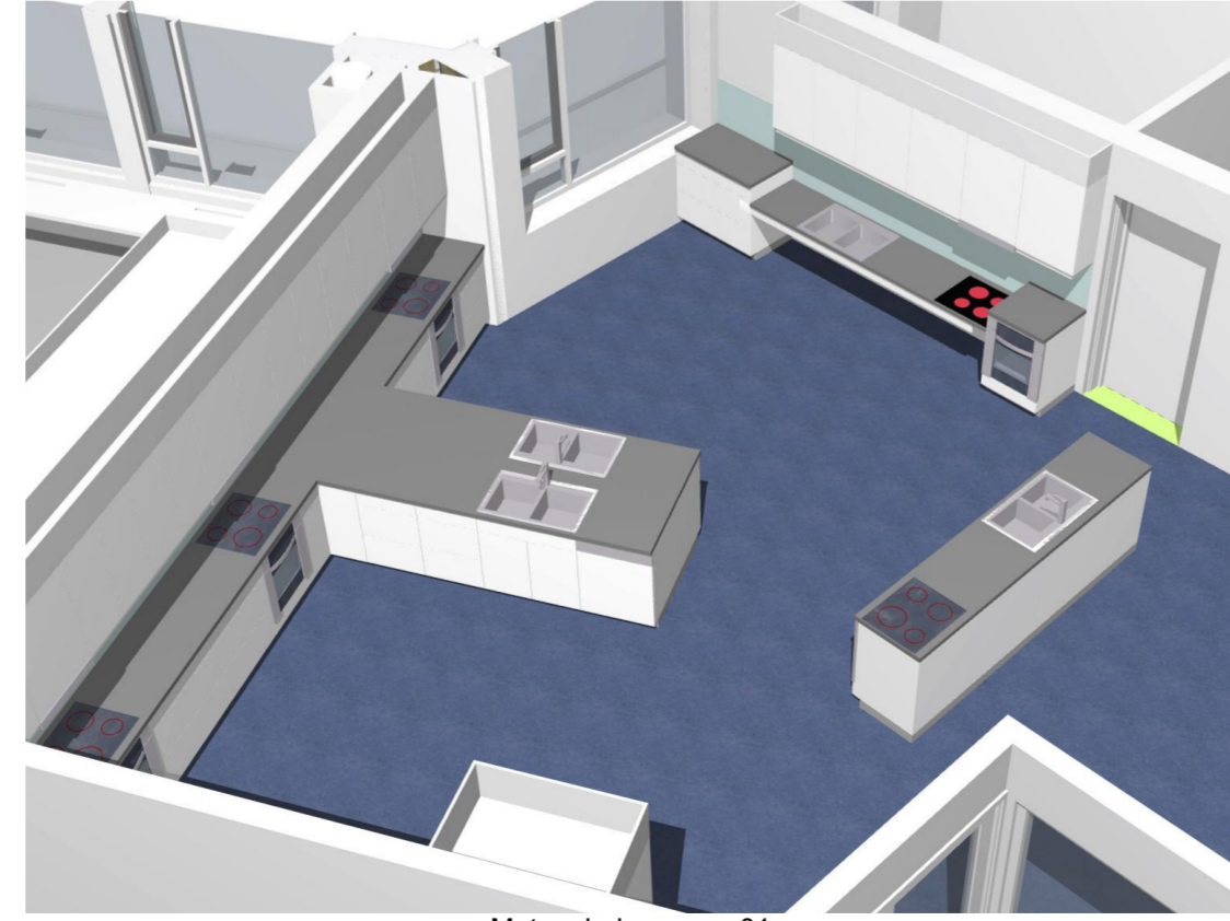
Mat og helse persp 01