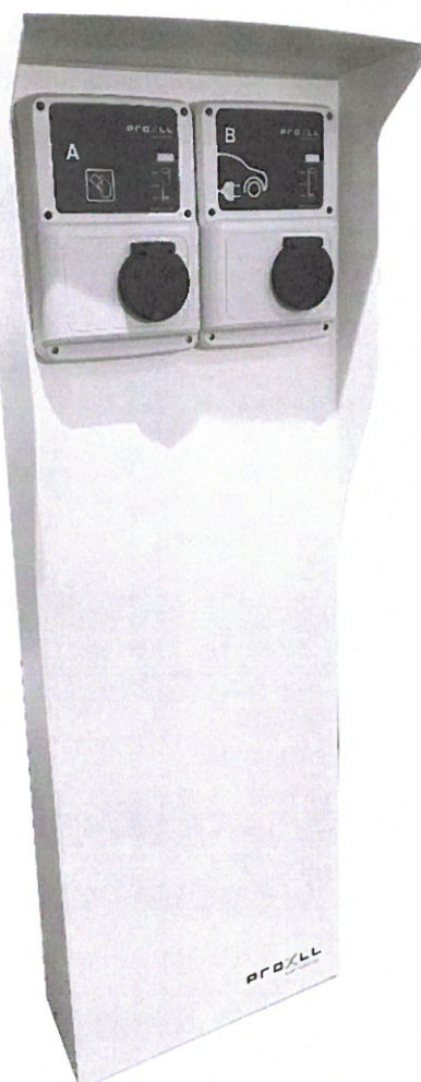
9477083 LADESTOLPE FOR WBM PED2 Nedstøpningsfundament følger med produktet.