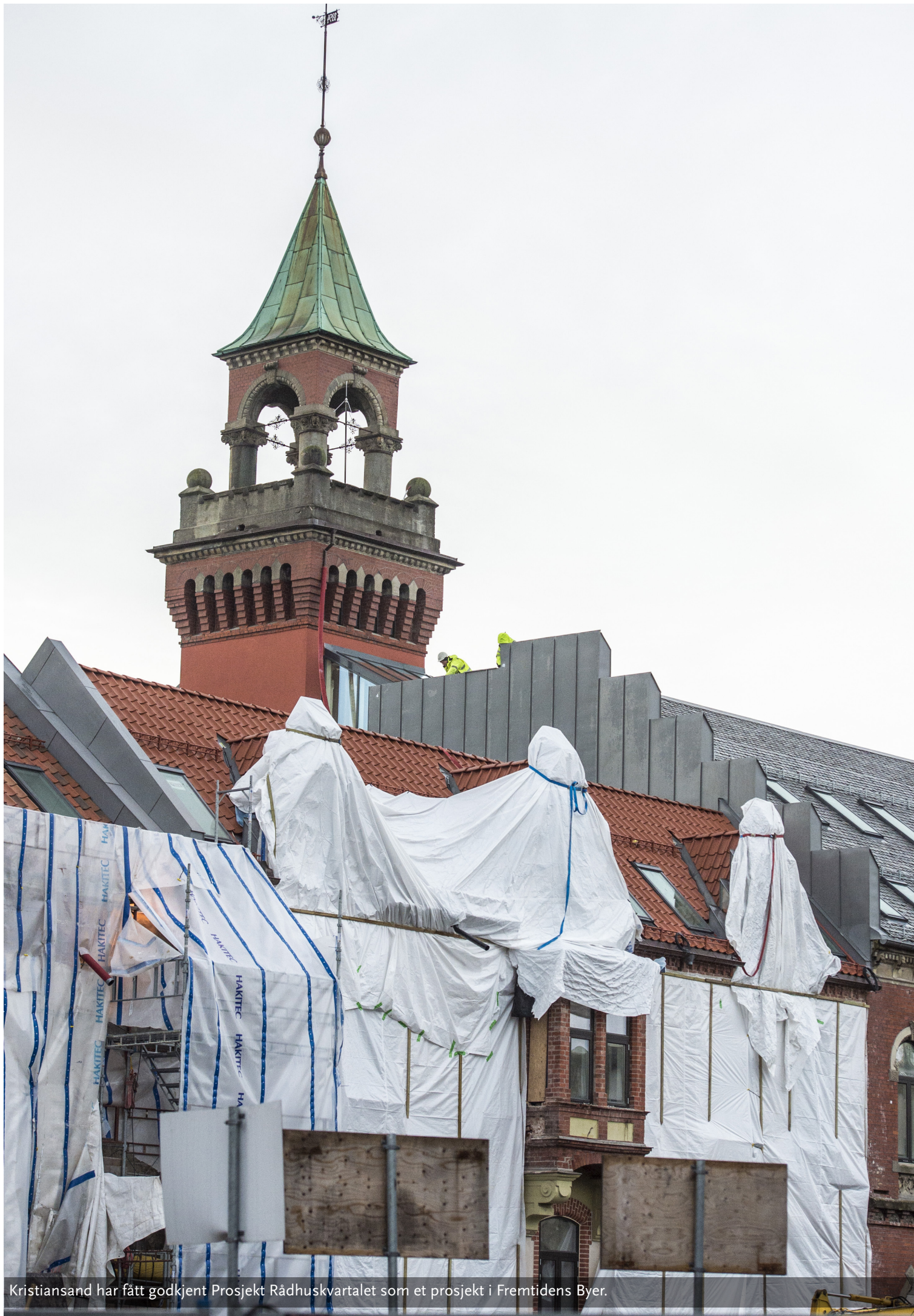
Kristiansand har fått godkjent Prosjekt Rådhuskvartalet som et prosjekt i Fremtidens Byer.