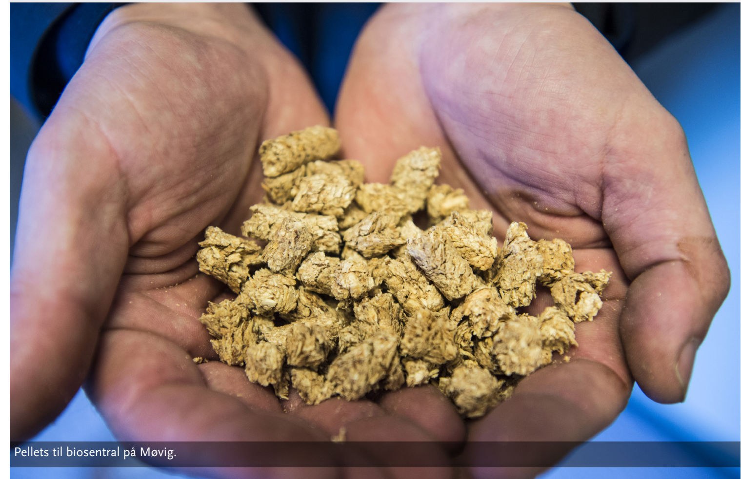
Pellets til biosentral på Møvig.

Kristiansand Eiendom skal redusere miljøbelastningen som følge av anskaffelsesaktiviteten ved å stille relevante miljøkrav til leverandører og leveranser.