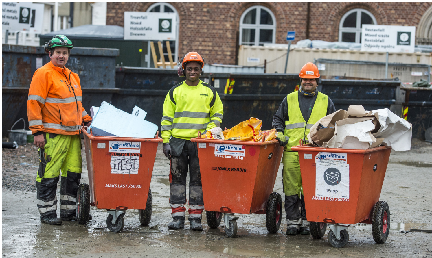
God avfallshåndtering gir en ryddig byggeplass og et tryggere arbeidsmiljø.