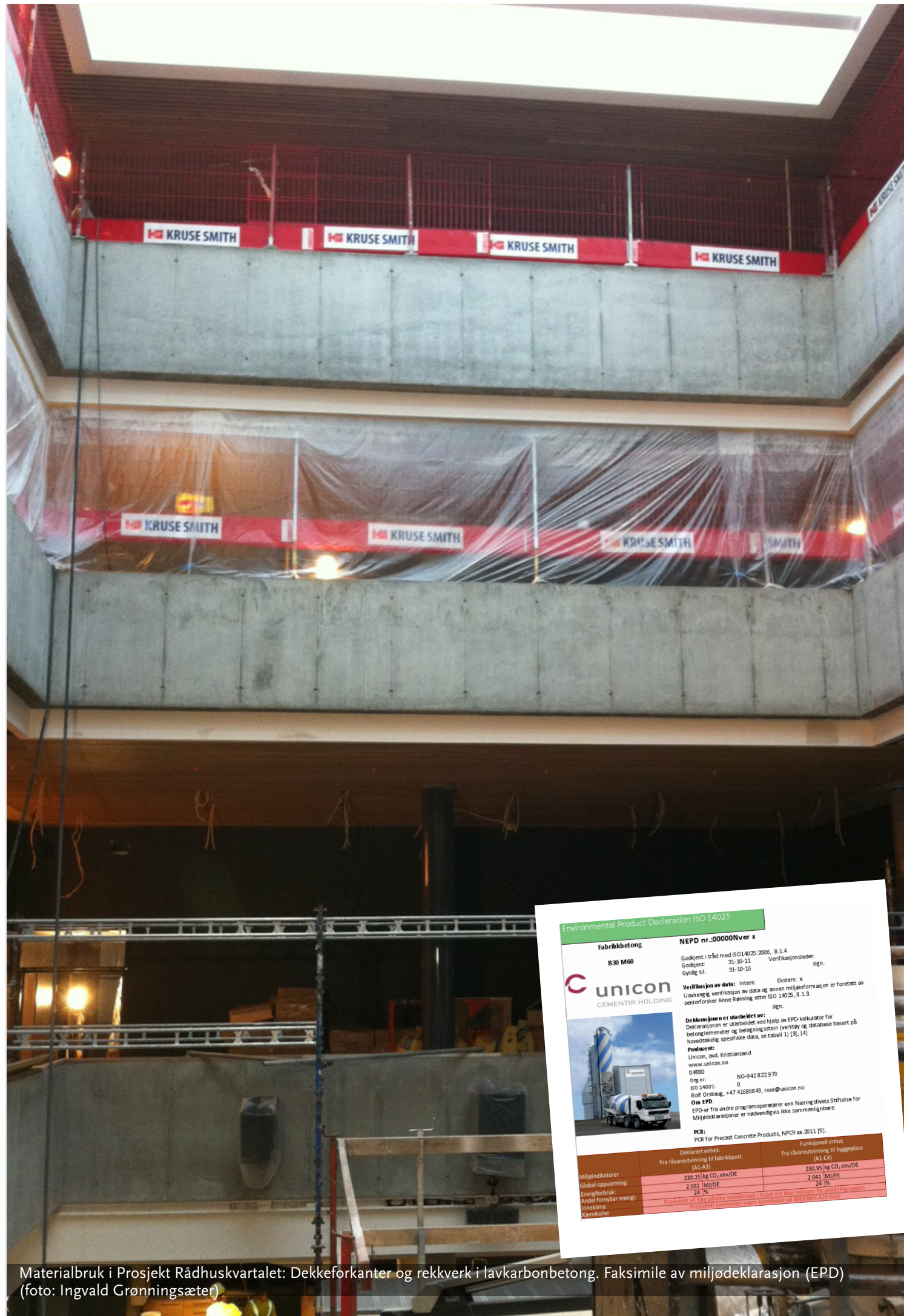
Materialbruk i Prosjekt Rådhuskvartalet: Dekkeforanter og rekkverk i lavkarbonbetong. Faksimile av miljødeklarasjon (EPD)