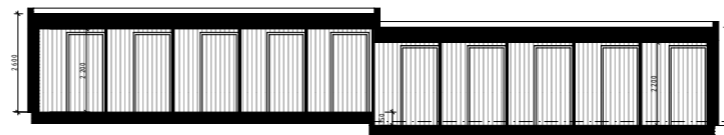
1:200 Snitt F sportsbod