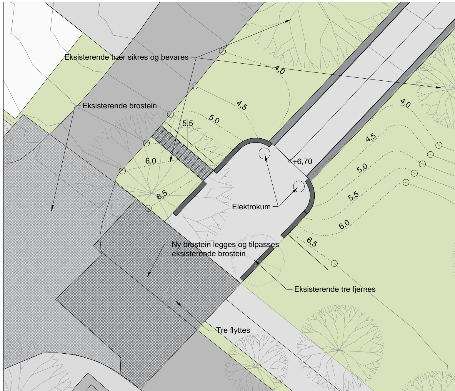
Detaljplan sør-vest A1=1:100