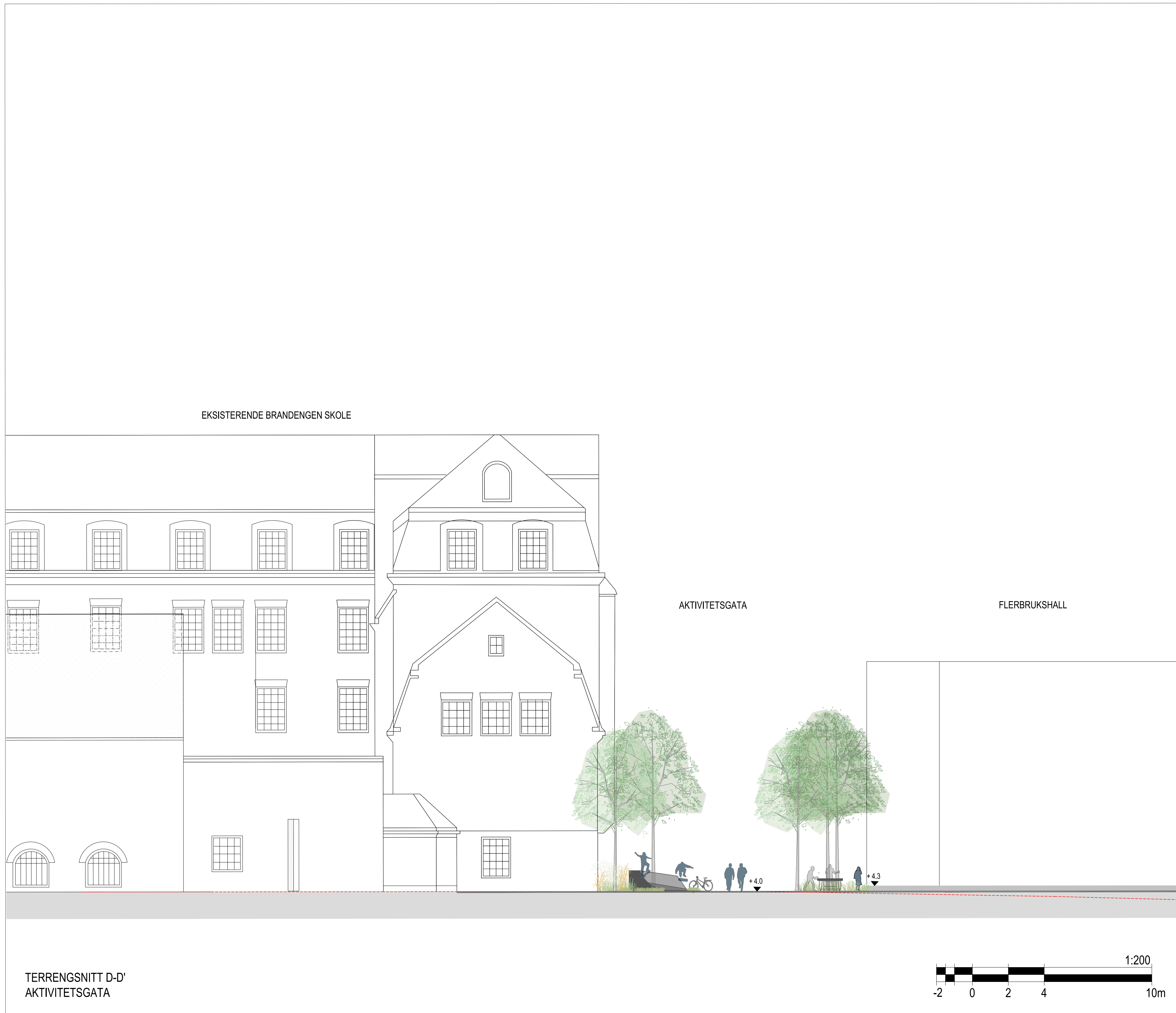
TERRENGSNITT D-D' AKTIVITETSGATA