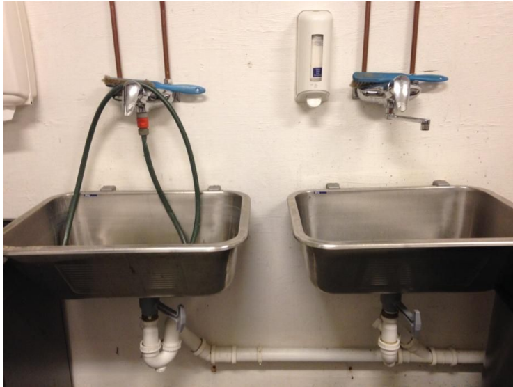
Utslagsvask. Bør kunne romme bløtlegging av gulvpad. Armaturløsning med uttak for oppfylling av gulvvaskemaskin.