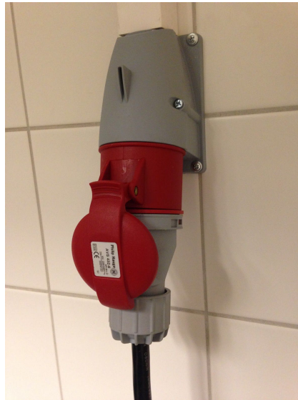
Eksempel fastmontert 400v 3-fas.

Her finnes nærmere info om størrelse, strøm m.m.