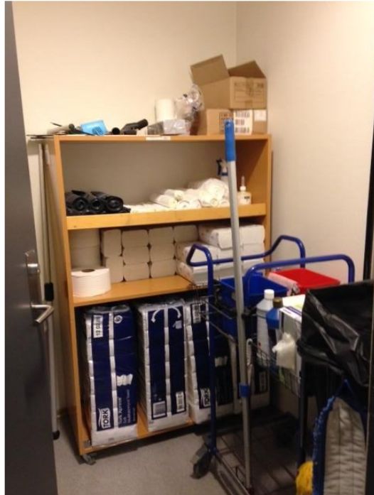
Eksempel - avklar behov

I bygg med flere etasjer må det planlegges renholdsrom i hver etasje med hyller, vask og plass for vogn. Og gjerne med slukrist i gulv for tømning av gulvvaskemaskiner.