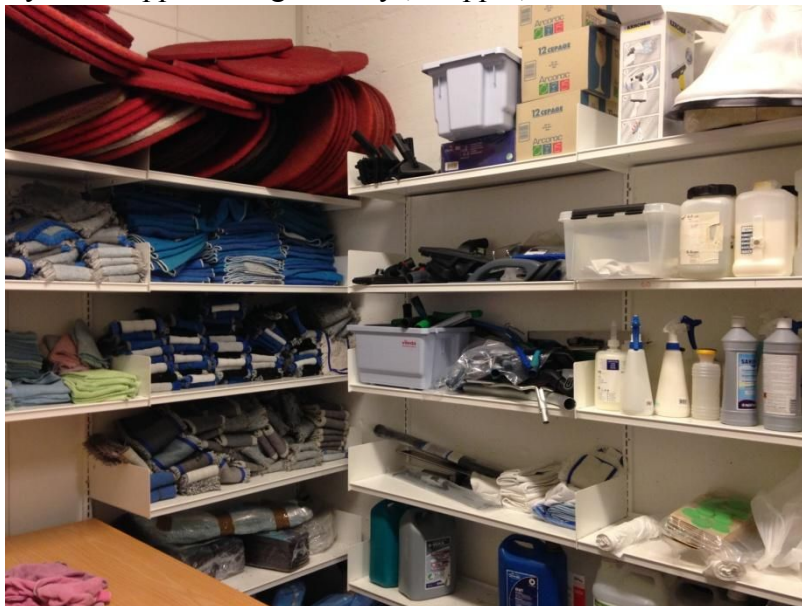
Eksempel - avklar behov