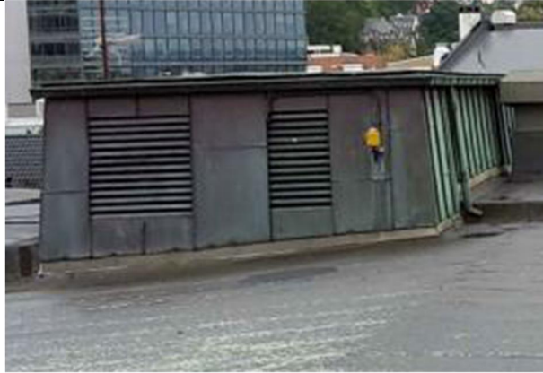
05 Oppbrett innnder NY båndtekking på fasade