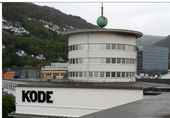
01 Tårnbygg, nedre del, tårn og kuppel. Puss og isolasjon skjæres vekk nede før oppbrett og beslag etableres. Isolasjon og puss reetableres.