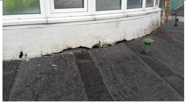
12 Oppbrett takpapp innunder ny isolasjon og puss på tårnbygg