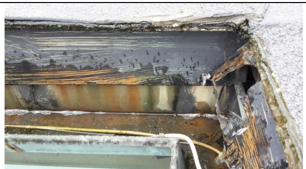
10 Prinsipp eksisterende utførelse på gesims 1 i dag. Tjære-papp skjæres vekk, gamle beslag rives, takrenne rives i den grad det er nødvendig. Ny takrenne, nye belag iht. til detalj. Ny bitumenbasert tekking.