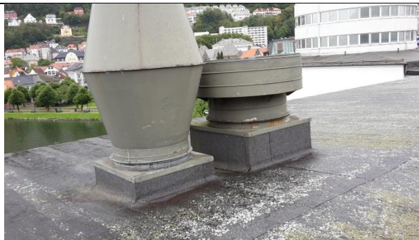
07 VV1 og VV2