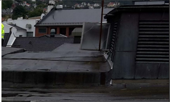
11 Oppbrett fra takoppbygg 3 innunder NY båndteking på takoppbygg 2.