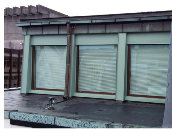
17 Beslag rundt vindu på fasade i 4. etasje