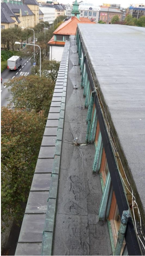
21 Øverste gesims, gesims 1 og gesims 2. Fasade i 4. etasje.