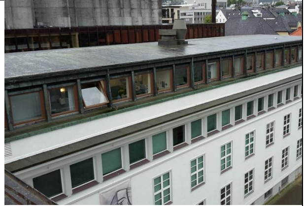
18 Beslag rundt vindu på fasade i 4. etasje