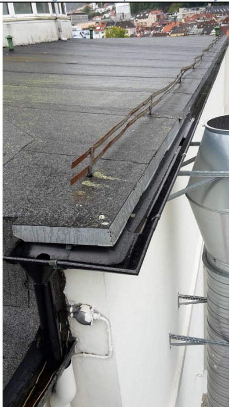
19 Snøfanger på nedre del av tårntak