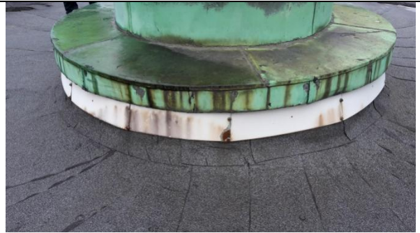
14 Bunn sokkel, gammelt beslag og kopper rives vekk og erstattes med nytt.