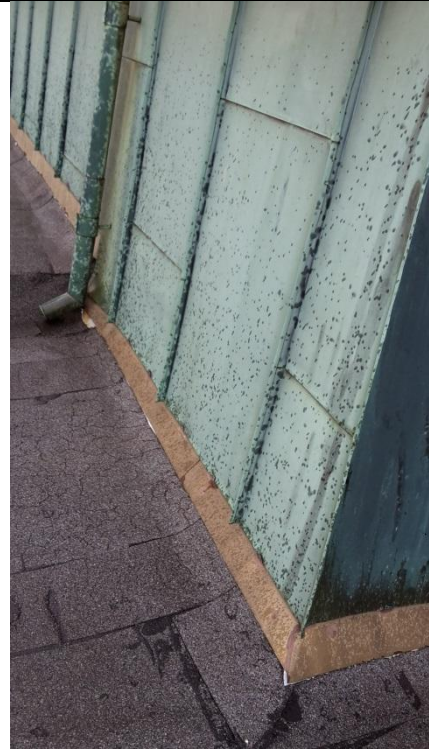
16 Takoppbygg med beslag innunder båndteking. Beslag rives sammen med båndteking.