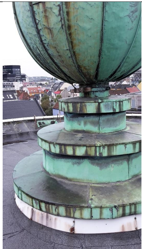
24 Kuppel på tårn