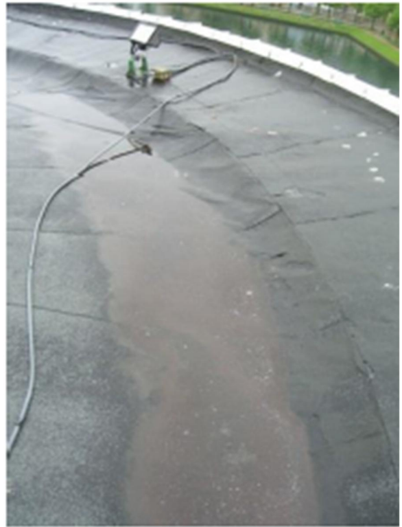
22 Tårnsal, yttertak, feil fall.