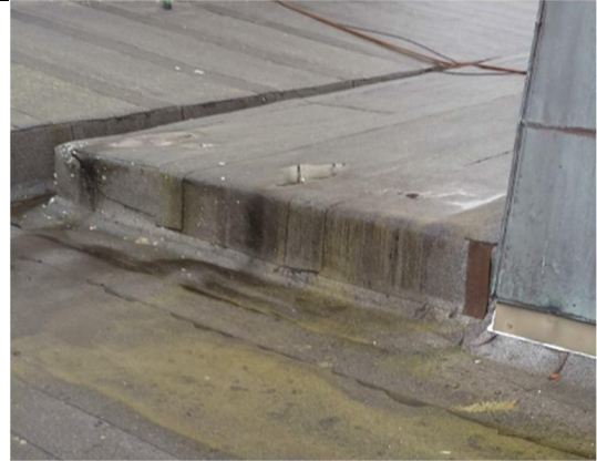
06 Oppbrett og nedbrett takoppbygg 3 til hovedtak. Nedbrett fra nedre del av tårnbygg ned på hovedtak inkl. renne.