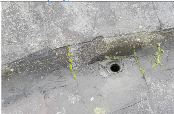
03 Sluk på tårntak