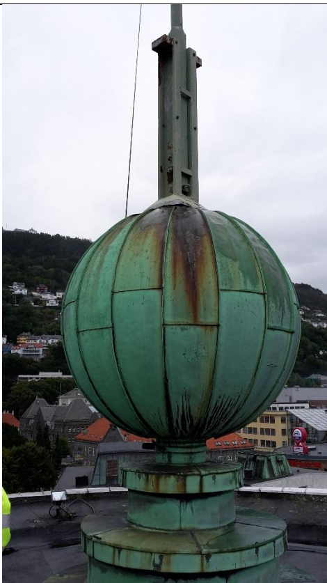
23 Kuppel på tårn