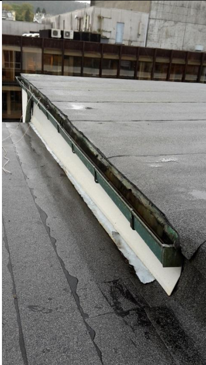
15 Takoppbygg 1, med 2 stk. beslag inn mot «vegg». Et overliggende og et underliggende.