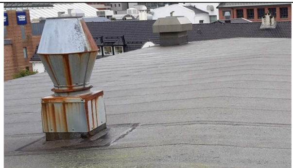
08 VV4 og VV5