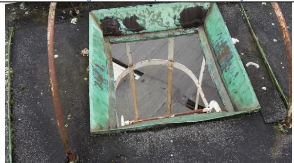
20 Leider opp til topp på tårn