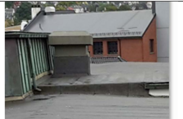
04 Oppbrett og nedbrett, takoppbygg 1 til hovedtak. Oppbrett fra takoppbygg 1 innunder NY båndtekkning og evt. takrenner på takoppbygg 2. VV3 på takoppbygg 1.