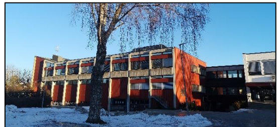
Eksisterende bygg B