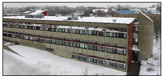
Eksisterende bygg A (skal rives)