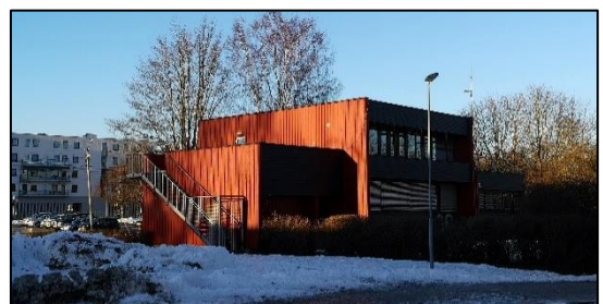
Eksisterende bygg E (skal rives)